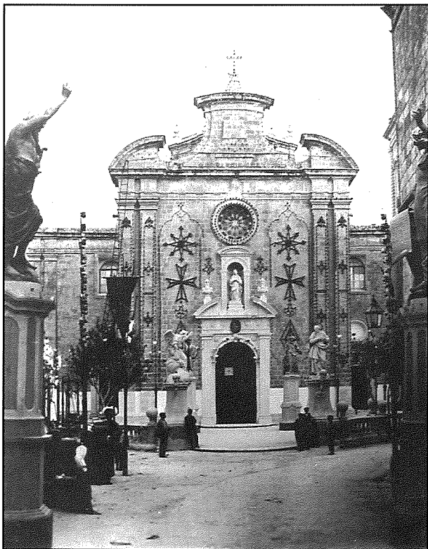
Dehra tal-knisja parrokkjali minn barra armata għall-festa titulari tal-Lunzjata. Ritrat x'aktar ta' l-ewwel kwart tas-seklu 20, meta l-faċċata kienet għadha tinxteghel bil-lampi taż-żejt.

Dun Xand Cortis jibda biex jgħid li l-Balzanin “għandhom fid-demmi għall-festa tal-Lunzjata,” xejn inqas min-nies ta' lokalitajiet oħra għall-festa titulari tagħhom. 8 Lejn tmiem is-seklu 19 meta kiteb Cortis, il-festa tal-Lunzjata f'Hal Balzan kienet tiġi ċelebrata fil-jum liturġiku tagħha, jiġifieri nhar il-25 ta' Marzu. Dak iż-żmien dan il-jum kien għadu mhares bhala festa kmandata. Fis-sena 1895 il-25 ta' Marzu kien it-Tnejn. Għaldaqstant, jikteb