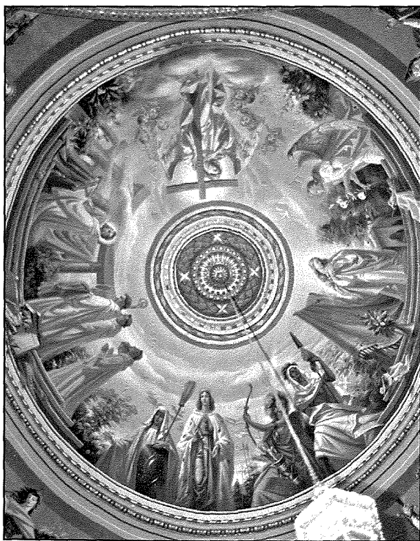
Ritratt li juri l-pittura tal-koppletta tal-Kurċifiss, xoghol il-pittur il-Prof. Emvin Cremona, liema biċċa xoghol inbdiet fl-1961.

Ix-xena artistika Maltija fis-snin sittin kienet mahkuma minn artist wiehed – il-Kavallier Emmanuel Vincent Cremona jew ahjar Emvin Cremona. In-nies ta' madwar il-knejjes Maltin kienu jiftahru li ghandhom xi xoghol ta' dan l-artist izejjen parti mill-knisja. Il-bolol ta' Malta kienu juru dejjem xi disinn li hareġ mill-pinzell ta' Emvin Cremona. Jekk trid xi biċċa xoghol biex tpoġġiha fis-salott mur ghand Emvin Cremona. Xi parir fejn tidhol l-arti kien iwassal ghand Emvin Cremona. Hal Balzan ukoll missu minn dan il-wirt artistiku li hallielna dan l-artist. Izda qabel xejn, min kien Emvin Cremona?