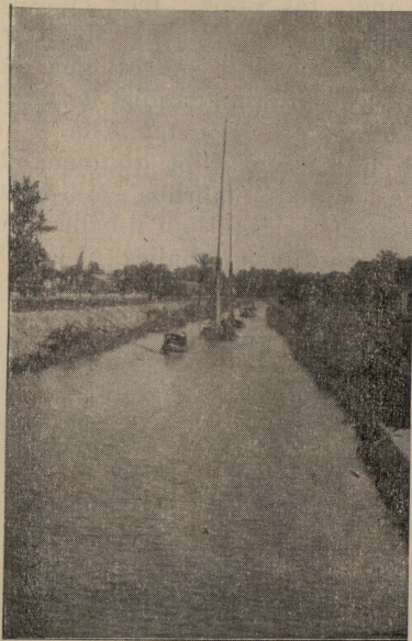
L-Eġittu — Dehra ta' biċċa mill-Kanal tas-Swejz.

naraw wieħed minn dawn il-Bedwin b'martu fuq il-ġemel. Kif raw lilna, l-mara marret tinheba, u hu baqa' jistenna sa kemm għaddejna. Imbagħad raġa' għabba l-mara u telqu lejn triqthom.