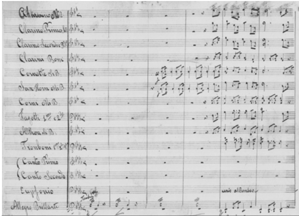
Paġna minn tal-partitura li fiha jidhru l-ewwel battuti (l-ewwel movement) tal-Innu a Pio Nono ta' Bartoli miktub fl-1877

ħafna ( fortissimo ), fejn kull wieħed jerga' jiftaħ fi krexxend. 3 Fit-tielet u r-raba' battuta jidhlu miegħu l-kurunetti u s-saxhorns Mib , u dlonk warajhom, il-bqija tal-banda, fi stil t'overtura Franciża, fejn il-kromi bil-punt + semikromi jiddominaw. Is-16-il battuta li jigu wara huma mqassmin f'żewġ sentenzi ugwali, b'żewġ frażijiet t'erba' battuti kull waħda. It-tieni sentenza timmodula lejn il- Lab Maġġuri .