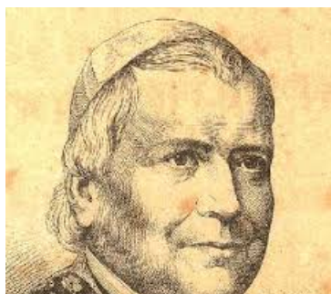
Papa Piju IX (1792-1878) li għalih dal-Innu oriġinarjament kien miktub