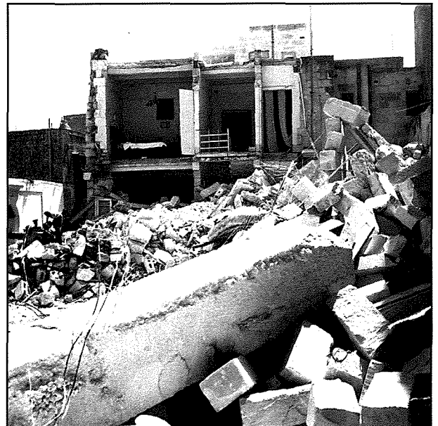
Dehra tal-istraġi li halliet warajha l-isplużjoni li ġrat f'Hal Balzan fil-lejla tas-16 ta' Mejju 1969.

Il-gazzetti tal-ghada rappurtaw l-isplużjoni li ġrat f'Hal Balzan tard il-lejl ta' qabel. Fi stop press , it- Times of Malta qalet li l-isplużjoni qerdet għal kollox dar u garaxx, li jġibu n-numri 124/125, Triq il-Kbira, proprjetà ta' Lewis Grech Sant mill-Belt Valletta. Issemmi wkoll li kien hemm il-biża' li raġel xwejjah li kien jghix fit-terran tal-post seta' ntradam taht it-terrapien. 3 L-Orizzont ukoll semmiet