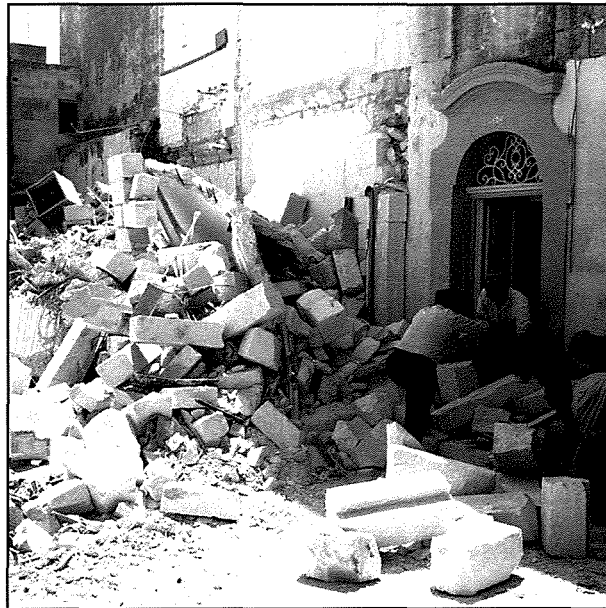
Hafna Balzanin taw id-daqqa t'id tagħhom lir-residenti tal-qrib li ntaqta b'mod jew iehor minn din l-isplużjoni.

li, filwaqt li ma setax jesprimi ruhu f'dak l-istadju billi l-każ kien quddiem il-Qorti, ittiehdu passi immedjati biex it-tliet familji milquta jingħataw akkomodazzjoni temporanja. Offrewlhom fejn joqogħdu l-Isla, ir-Rahal il-Ġdid, Santa Luċija, u Birkirkara, iżda sa dakinhar post wiehed biss kien ġie aċċettat. Il-familji l-oħra kienu għadhom qed jikkunsidraw fejn se jaċċettaw li jmorru joqogħdu. Iżda, issokta l-Prim Ministru, kienu għadhom qed isiru sforzi biex tinstab akkomodazzjoni alternattiva temporanja għall-familji milquta mill-isplużjoni. 18