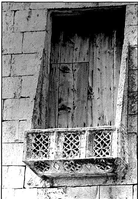
It-tieqa muxrabija tad-dar numru 123 fit-Triq il-Kbira li nqerdet fl-isplużjoni.