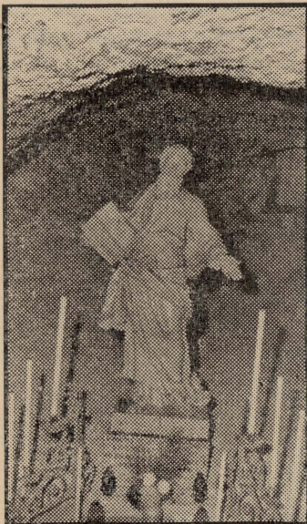
Statwa ta' San Pawl fil-Grotta tar-Rabat, minn fejn jittiehed it-trab li jinghad li huwa duwa li tfejjaq il-ġdim tas-srieġ.

Billi dawn l-eghrien tal-habs huma mhaffra fil-blat ta' taht is-sur, gewwa l-foss (jigifieri qeghdin fl-iskarpa) aktarx li n-nies il-mahlula li kienu jinzammu hemm kienu jithallew jorhorġu għall-arja gewwa l-foss innifsu, bħal ma kienu l-maqbudin tal-gwerra tal-1914-1918 fil-foss ta' Verdala, hawn Malta. Kienu jkunu