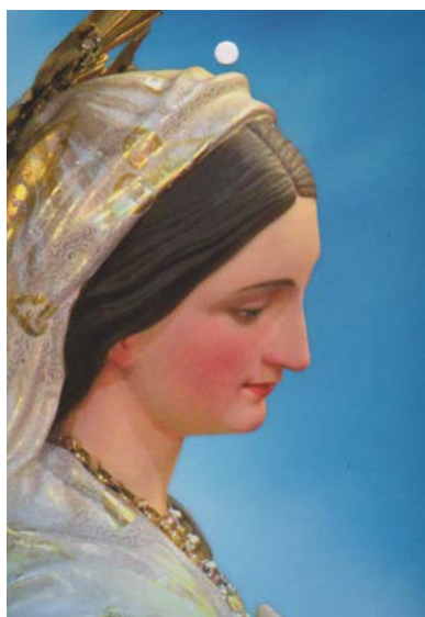
Vara tal-Madonna tal-Ġilju meqjuma fil-parroċċa tal-Imqabba

Il-Fanfarra (b. 125 2 -133) li tiftaħ it-tieni moviment għandha mill-istess rwol tal-oħra li biha fetaħ l-ewwel moviment, jiġifieri li sservih t'introduzzjoni. Haġa li tolqot mill-ewwel l-ghajn hija l-bidla in permanenza fit-temp minn wieħed doppju ta' żewġ semiminimi kull battuta għal wieħed ordinarju ta' b'erba' taħbitiet. Il-fanfarra min-naħa tal-kurunetti u t-trumbuni hija akkumpanjata minn trilli u skwilli tal-istrumenti tal-qasba, u l-aċċenti li jtaqqlu mixjet l-ewfonji u l-baxxi. Wieħed jinnota wkoll id-daqq tal-pjatta bil-mazza minflok jithabbtu ma' xulxin.