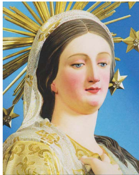
Vara tal-Madonna tal-Gilju, meqjuma fil-parroċċa Mqabbija

Qabelxejn nixtieq ngħid, li mill-ammont ta' strofi li fih, l-Innu ma jidhirx li kien originarjament intiż għal biex jiġi mmużikat f'xi innu solenni, u huwa aktar adattat għal xi innu popolari, jew forsi ftit aktar minn hekk, innu-marċ. Il-fatt biss li huwa strofiku, fejn għandek sensiela ta' strofi mbejna bil-versi tar-ritornell, ma jhallilekx wisq wisa' fejn tista' timrah b'movimenti u tempijiet differenti. B'kollox, l-Innu fih hames strofi bil-versi tat-tmienja u bis-soltu rima a-b-ċ-b. U l-istess jingħad għar-ritornell. F'dak li huwa hsieb, il-poeta jiftaħ dil-għanja proprju billi jiddikjara li l-gilju huwa wiehed mill-ward li l-aktar ifewhu l-gonna, u li bi bjuda u s-safa tiegħu, il-qalb togħxa flimkien mar-ruħ. Wiehed ma jridx jinsa li l-gilju jirrappreżenta s-sbuħija u huwa wkoll is-simbolu tas-safa. Fit-tieni strofa mbaġhad, il-poeta jdur fuq Marija u jqabbilha mal-kwiekeb kollha dija, u li bi ġmielha tisboq lix-xemx. Jgħidilha