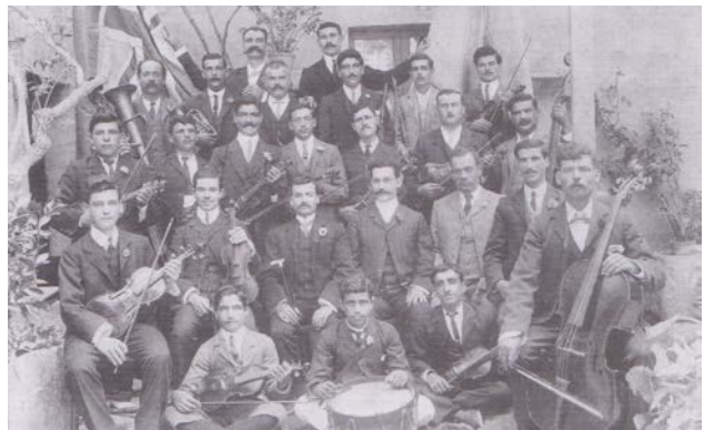
Għaqda Mandolinistika Lijana 'Fior d'Arancio', imwaqqfa fl-1894