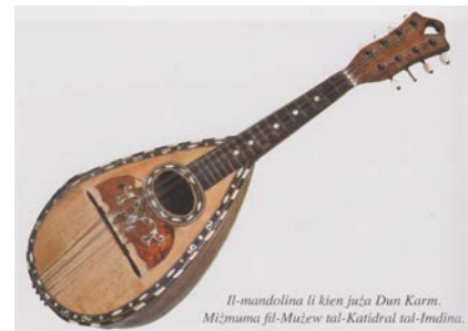
Il-mandolina li kien jażo Dun Karm. Miżmuma fil-Mużew tal-Katidral tal-Imdina.