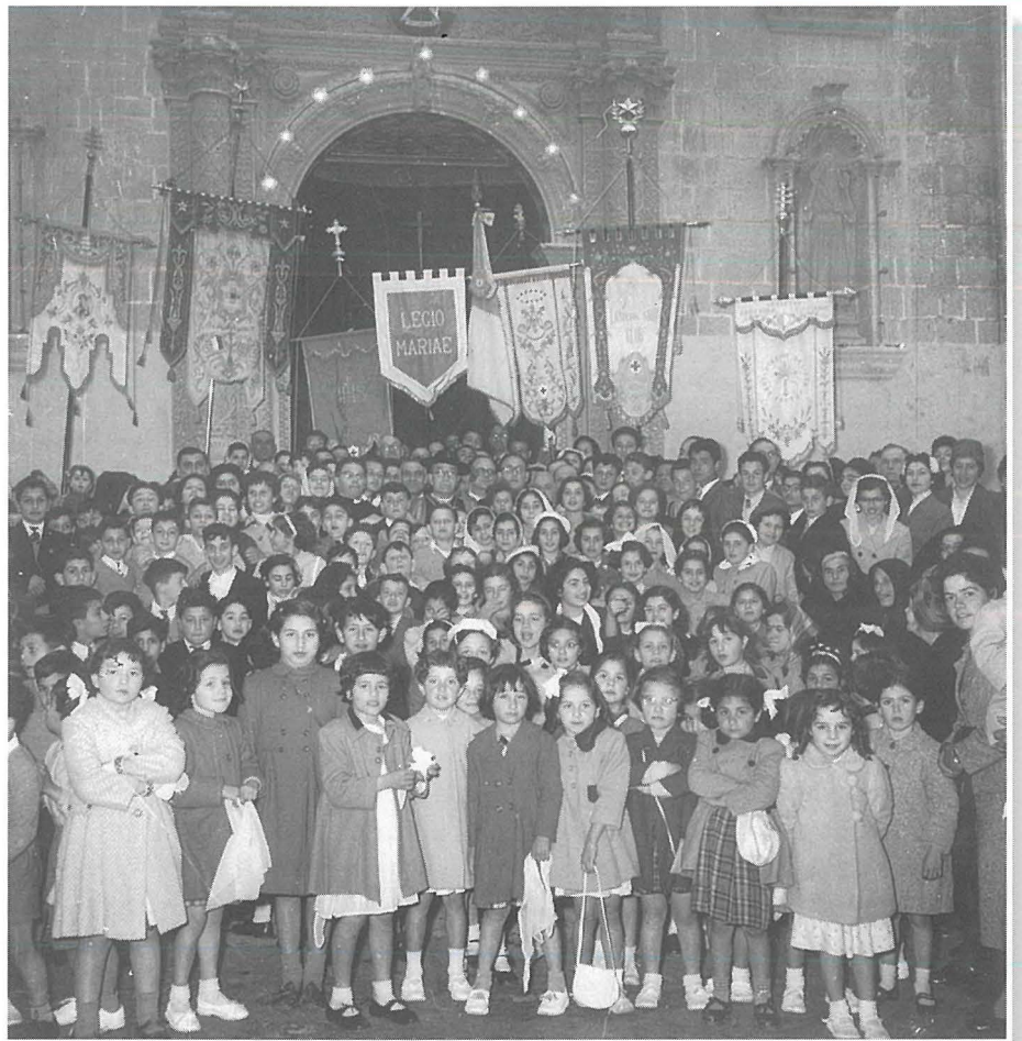
Flimkien ma' numru ta' parruċċani speċjalment mat-tfal