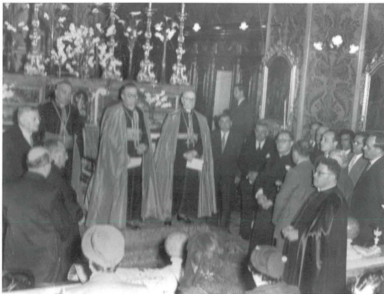
Il-Kappillan Balzan flimkien maż-żewġ Monsinjuri preżenti u r-rappreżentanti tal-għaqdiet reliġjużi u ċivili

sena tiegħu bħala kappillan, kien twaqqaf kumitat taħt il-presidenza ta' Dun Pawl Pace, li kien jinkludi lill-kleru u rappreżentanti tal-għaqdiet kollha tar-raħal, sew dawk reliġjużi kif ukoll ċivili.