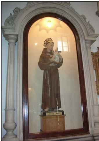
Statwa ta' Sant' Antnin li hemm fil-knisja Ta' Lapsi, San Ġiljan