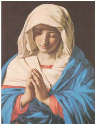
'Lilek Omm Alla' (Angelus) - Innu tislima lill-Madonna

L-Angelus hija talba qasira, normalment l-Ave Marija, li tingħad tliet darbiet matul il-ġurnata, i.e. filgħodu, f'nofsinhar, u filgħaxija. Tissejjah hekk għax tibda bil-kliem Latin: Angelus Domini Nuntiavit Mariae – l-Anglu t'Alla ħabbar lil Marija.