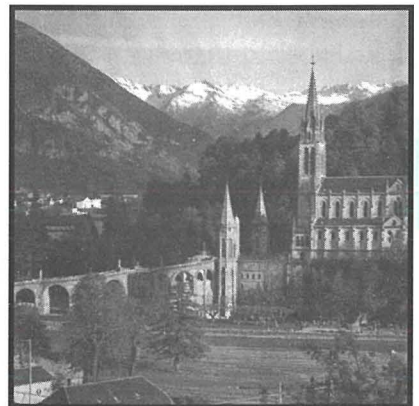
Il-Belt ta' Lourdes fejn fl-isfond jidhru l-muntanji tal-Pirinej.

Il-muntanji tal-Pirinej jiffurmaw fruntiera naturali bejn Franza u Spanja. Fit-tramuntana tal-muntanji, fin-naha ta' Franza, wiehed isib art għammiela fil-waqt lejn in-nofs in-nhar taghhom, fin-naha ta' Spanja, wiehed isib irdumijiet fondi. Il-muntanji tal-Pirinej joffru diversi attrazzjonijiet turistiċi bħal nghidu ahna għadd ta' sports sajfin u xitwin