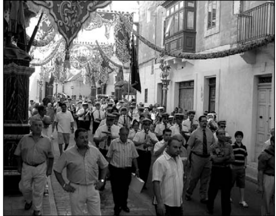
Il-Banda Cittadina King's Own waqt il-marċ tagħha qabel il-purċissjoni.

Own 1 iddoqq għall-festa tal-Lunzjata. Ironikament din il-Banda ghadha tiġi ddoqq hawn f'Hal Balzan eżattament f'Jum il-Festa meta ghas-6.30pm tagħmel marċ sakemm fi nżul ix-xemx tilqa' l-istatwa tal-Lunzjata bid-daqq tal-Ave Maria. L-istess Banda King's Own taghti l-ahhar tislma bl-Ave Maria lil-Lunzjata fid-dhul tal-istatwa.