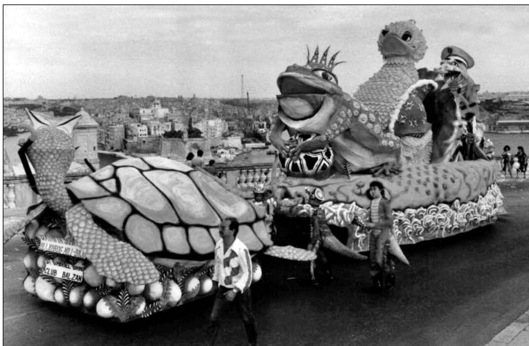
Fis-sena 1986, il-Każin tal-Banda San Gabriel kien ikkompeta fil-Kompetizzjoni Karru, Żifna u Kostum fejn gie kklassifikat fit-tieni post bl-isem 'U x'fatta skantajt b'li joħrog mill-bajd!'

Jalla l-ammont ta' membri jibqgħu jizdieđu halli nkomplu nkabbru din il-familja tal-Każin tal-Banda San Gabriel.