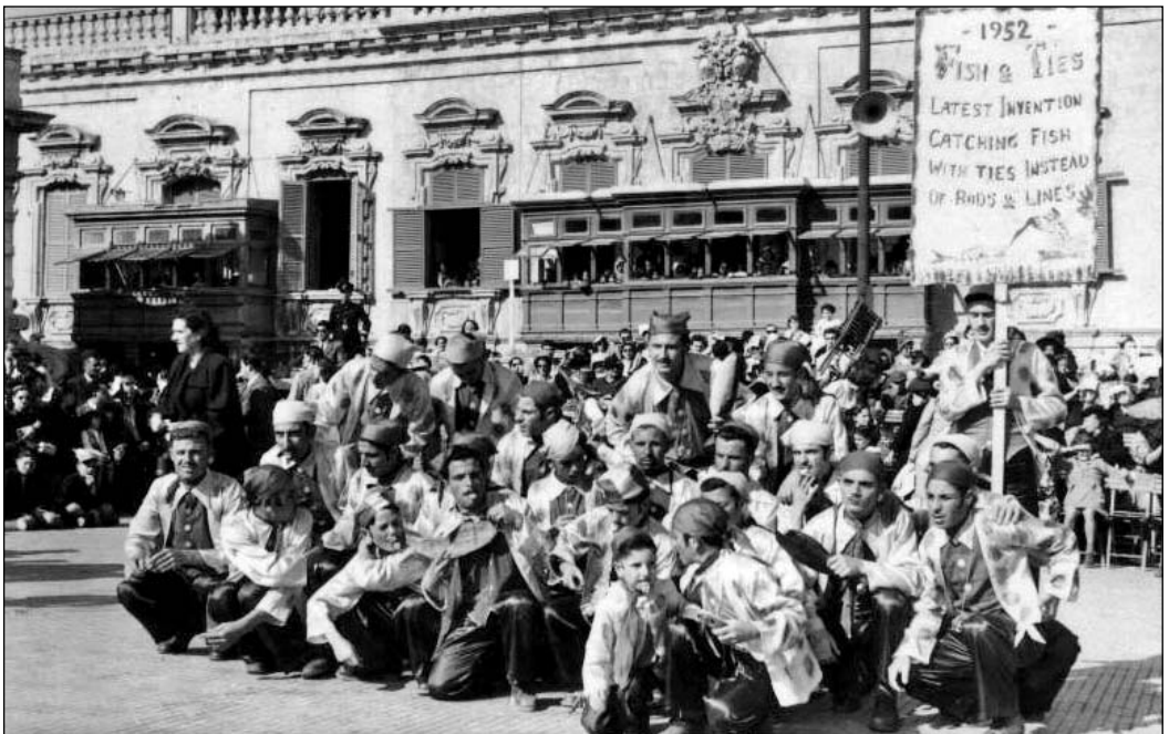
Il-grupp jippoża f' Misraħ San Ġorġ fil-Karnival tal-1952. L-isem kien 'Latest Invention - Catching Fish with Ties instead of Rods and Lines!'