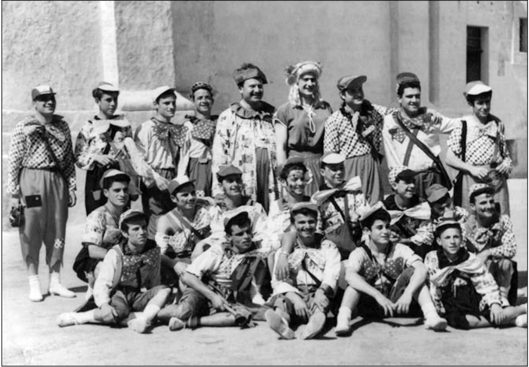
It-tema għall-Karnival 'Coming from the moon'.