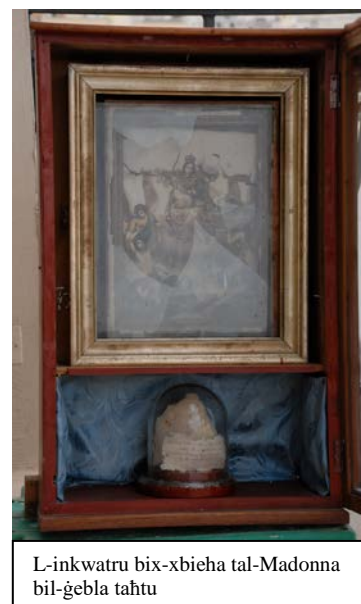
L-inkwatru bix-xbieħa tal-Madonna bil-ġebbla taħtu

Dun Anton kien kuntent bil-mużika tal-innu għax fi kliemu stess, 'il-mużika irnexxiet mhux ftit.' Jgħidilna wkoll li, 'l-istrofa principali timxi devota, imma r-ritornell jimxi qawwi u fl-istess ħin devot.' L-Innu 'tkanta l-ewwel darba fil-pubbliku fuq iz-zuntier tal-Knisja Parrokkjali tal-Gżira, fil-Festa tat-Titular tal-Gżira Tal-Karmnu, nhar it-8 ta' Lulju, 1951, mal-banda karmelitana taż-Żurrieq.' Jinfurmana wkoll li, 'il-mużiku u l-poeta kienu preżenti u kantaw mal-kor tat-tfal.' Kif kien mistenni, l-Innu intlaqa' tajjeb tant li, 'minn idejn in-nies ħarġet ċapċipa kbira'.