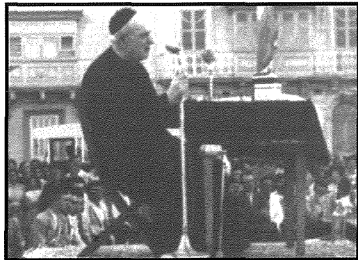
Dun Ġorġ f'wahda mil-laqgħat magħrufa bhala sajda

Dun Ġorġ Preca ta' A. Bonnici OFM Conv. Vol. 1, Kap 6 (1989)