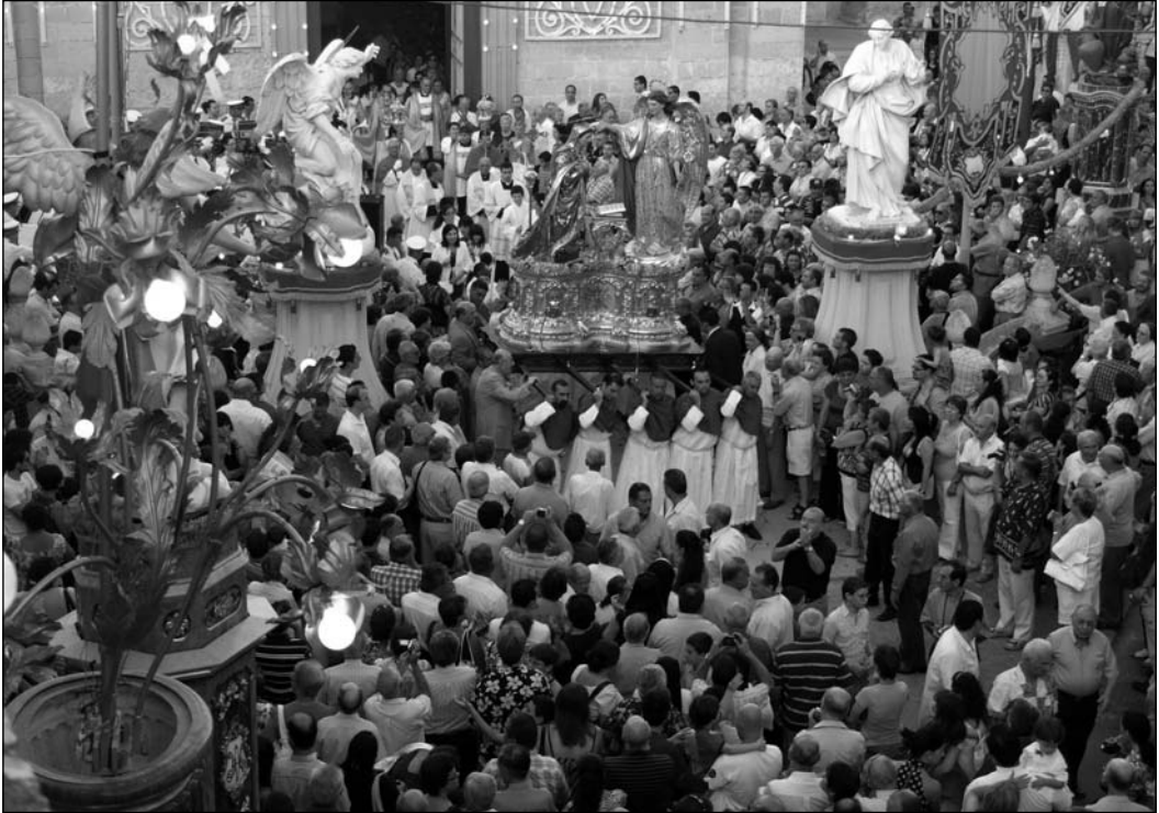
Mument mill-isbaħ waqt il-ħruġ tal-istatwa tal-Lunzjata f' nhar il-festa.