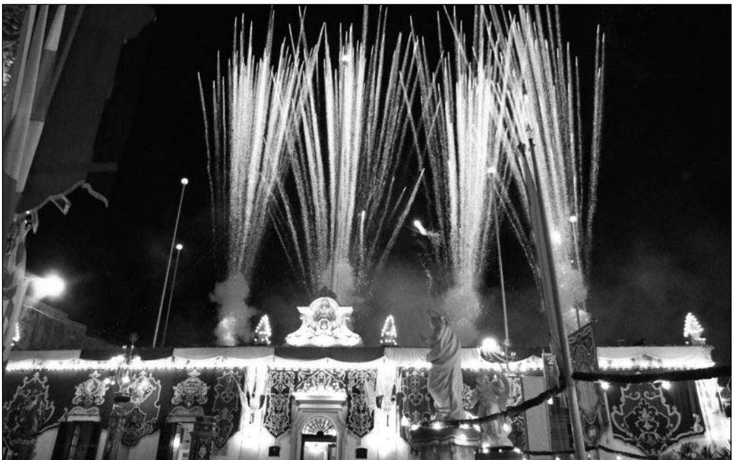
IL-Programm Mużikali li ttellà l-Banda San Gabriel fit-tieni jum tat-Tridu jkun akkumpanjat mil-logħob tan-nar.