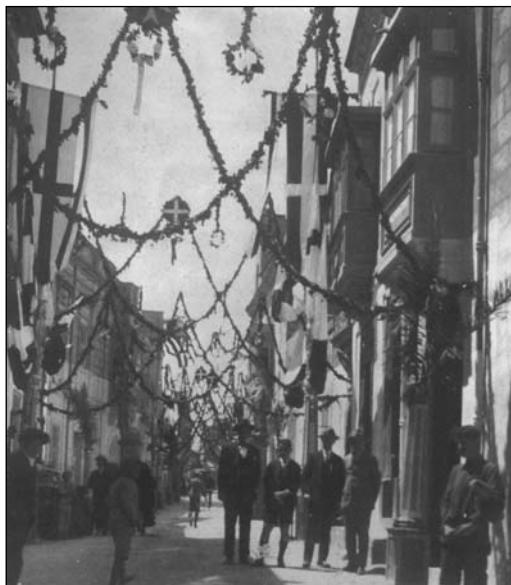
Strada Reale armata għal okkażjoni tal-festa tal-Lunzjata li kienet saret fid-9 ta' April 1925.