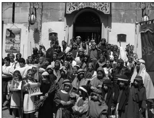
Uħud mill-personaġġi li jieħdu sehem fil-Purċissjoni ta' Hadd il-Palm organizzata minn din is-Socjetà.

serata mill-aktar pjaċevoli u familjari ġewwa l-Każin. Dan kollu jsir biex barra li l-membri jiltaqgħu flimkien ma' hbiebhom, isir ġbir ta' fondi halli nkomplu nkabbru l-attività tagħna.