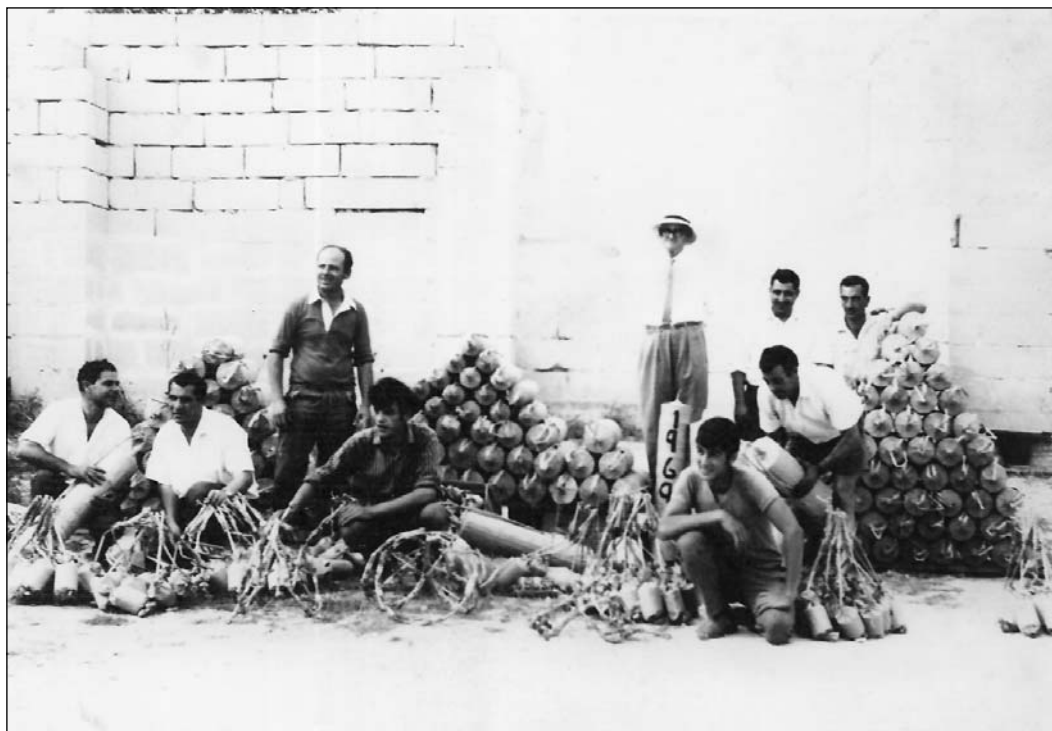
Programm ta' Nar kbir kien sar fis-sena 1969...is-sena tat-3 Ċentinarju.