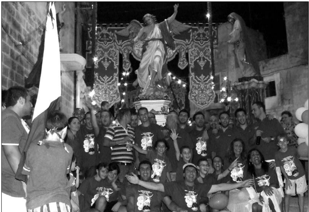
Membri ta' din is-Soċjetà ferħanin quddiem l-istatwa tal-Arkanġlu San Gabriel waqt il-marċ tal-Aħħar tat-Tridu.