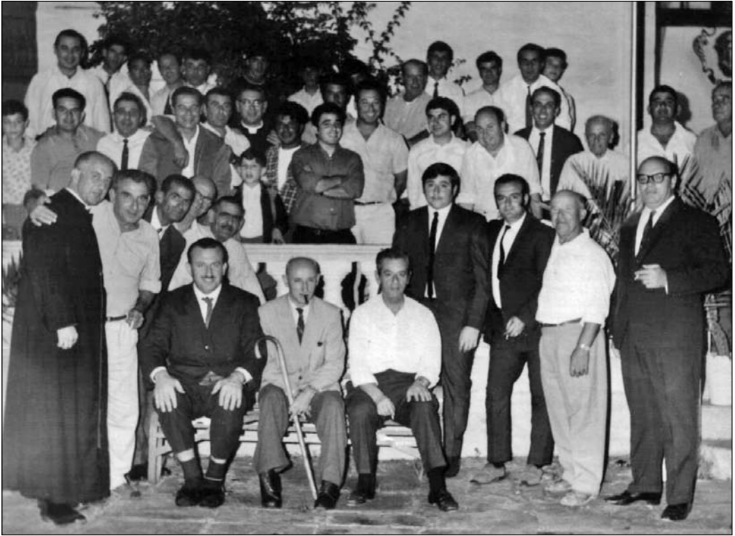
Araw kemm jirnexxielkom tagħrfu nies!