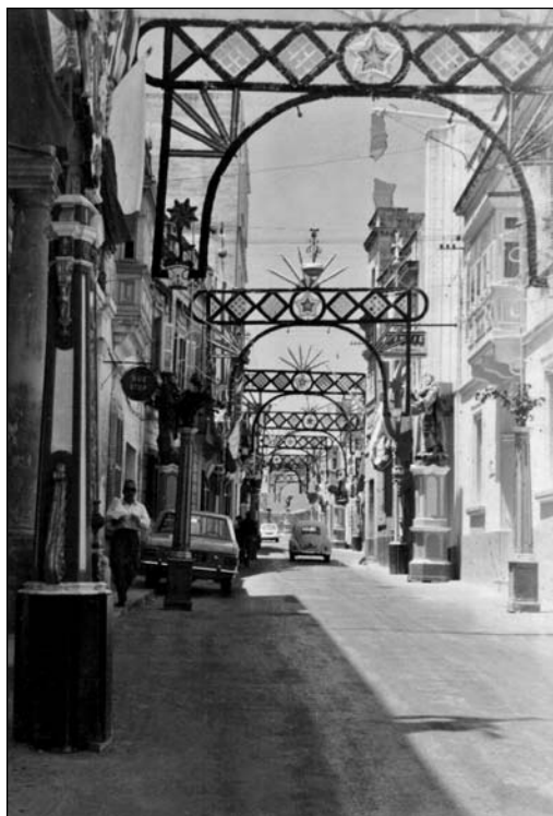
Triq il-Kbira mill-festa 1970 sal-festa 1973.