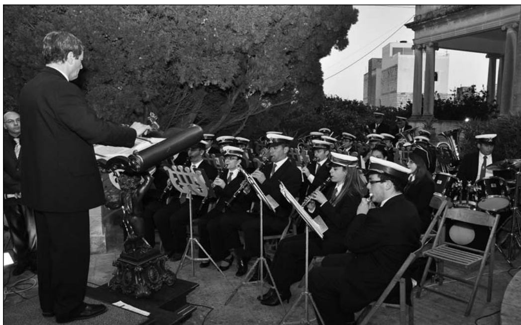
Il-Banda San Gabriel meta daqqet fil-Villa Macedonia f' Jum il-Ġonna organizzat mill-Kunsill Lokali Hal Balzan. Niġtakru li Villa Macedonia – illum l-Ambaxxata Spanjola – kien il-post fejn il-Banda San Gabriel rat it-twelid tagħha fit-23 ta' Marzu 1952.