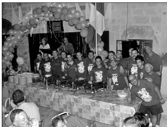
Uħud mill-membri li jagħtu sehemhom waqt id-diversi attivitajiet li jüttellgħu fil-Każin tagħna b'riżq il-festa.

Għall-okkazjoni tal-festa 2009 tfakkret il-25 sena ta' pubblikazzjonijiet. Dawn taw minjiera ta' informazzjoni b'diversi artikli dwar dak kollu li jorbot miegħu Hal Balzan...il-hajja tal-Każin, il-festa tal-Lunzjata, avvenimenti importanti, personaġġi Balzanin u ohrajn li rabtu isimhom ma' dan ir-rahal, hsibijiet reliġjużi, poeziji, ritratti antiki u riċenti...fi kliem iehor, għodda ideali għal dawk li jfittxu dawn it-tip ta' kotba festivi u