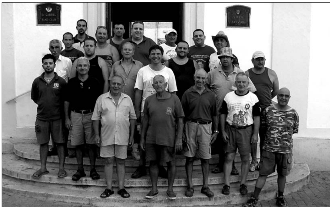
Fis-sena 2007, membri attivi tal-armar ferħana wara li lestew xogħolhom