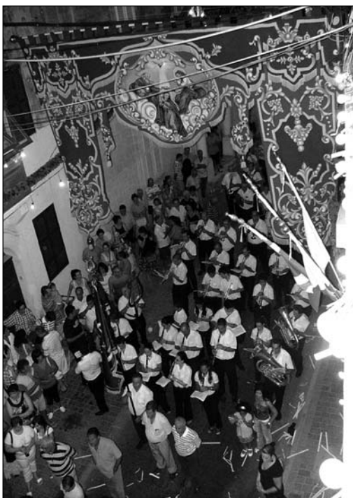
Waqtiet il-Banda San Gabriel fil-festa tal-Lunzjata.

fl-okkażjoni tas-sena ddedikata liż-żgħażaġh u fl-1985 ukoll. Fl-istess sena, fl-20 ta' Dicembru 1985, il-Banda San Gabriel hadet sehem bi programm mużikali f'Misrah il-Helsien fil-Belt Valletta fl-okkażjoni tal-kampanja tal-Milied 'Ifraħ u Ferraħ'. F'Settembru 1989, il-Banda San Gabriel hadet sehem bi programm gewwa l-Belt Valletta fl-okkażjoni tal-25 sena tal-Indipendenza.