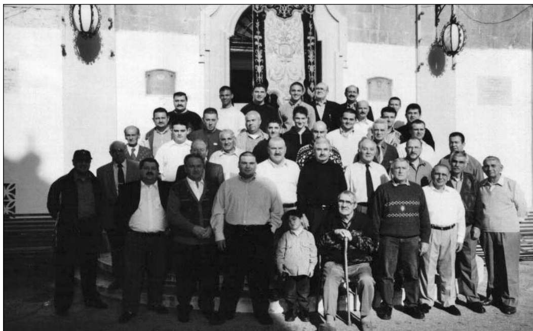
Membri attivi fl-armar fis-sena 2005