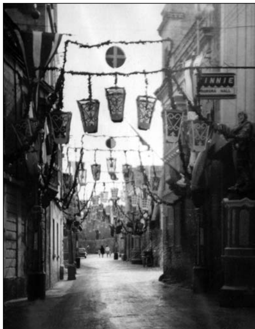
Triq il-Kbira fit-3 Ċentinarju tat-Tqegħid tal-Ewwel Ġebli tal-Knisja Parrokkjali 1669-1969.

U nkomplu nsemmu għrajjet il-Banda San Gabriel. Semmejna s-snin 50. Fis-sena 1962, il-Banda San San Gabriel hadet sehem fiċ-ċerimonja tal-ftuh tas-Sala Aurora, is-Sala Parrokkjali li min jaf kemm rat attivitajiet diversi kif ukoll programmi mużikali u strumentali mill-Banda San Gabriel. F'dik is-sena wkoll il-Banda hadet sehem għall-ewwel darba fil-festa ta' Santa Katerina ġewwa ż-Żejtun. Fl-1964 kienet ghamlet marċ madwar it-toroq Balzanin fl-okkażjoni tal-Festi tal-Indipendenza. Fis-sena 1965, il-Banda San Gabriel fethet il-festi tal-75 sena mit-twaqqif tal-Każin Marija Annunzjata kif ukoll hadet sehem fil-Kungress Nazzjonali tax-Xirka tal-Isem Imqaddes t'Alla