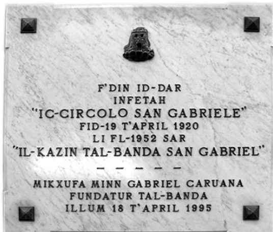
Il-lapida mal-faċċata tal-ewwel sede fi Triq Santa Marija.