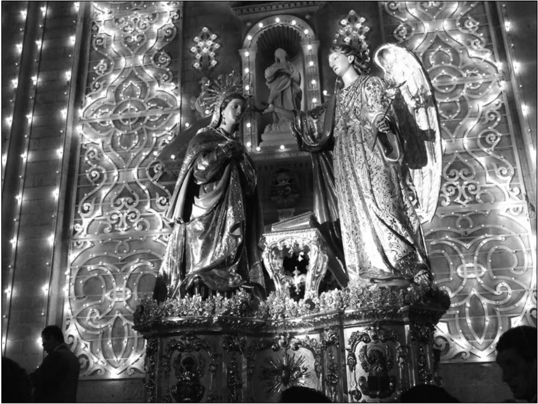
L-istatwa tal-Lunzjata u l-façċata tal-Knisja Parrokkjali mixgħula qabel id-dhul tal-istatwa lura fil-Knisja. Membri mill-Każin tal-Banda San Gabriel jieħdu ħsieb ta' kull sena l-armor tal-façċata tal-Knisja