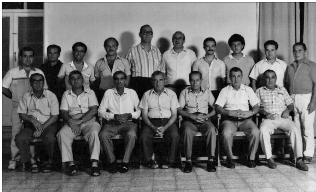
Membri attivi fl-armar fis-sena 1984

Il-Każin tal-Banda San Gabriel – Hal Balzan AD 1920 hu mmexxi mill-Kumitat Ċentrali taht it-tmexxija tal-President. L-istatut jghid li l-President, is-Segretarju, il-Kaxxier u d-Direttur huma l-erba' uffiċjali filwaqt li l-Kumitat jgħbor fih 11-il membru iehor. Niftakru li l-istatut kien ġie aġġornat fis-sena 2008. Wara diversi xhur ta' laqgħat minn kumitat apposta, l-istatut ġie rivedut u approvat fis-Seduta Ġenerali Straordinarja miżmuma nhar il-Hadd 20 t'April 2008. Insibu wkoll Sotto-Kumitat Nisa u s-Sotto-Kumitat Żgħażaġh San Gabriel.