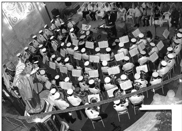
Il-Programm Mużikali ta' fuq iz-zuntier tal-Knisja fit-Tieni Jum tat-Tridu fil-festa tal-Lunzjata.