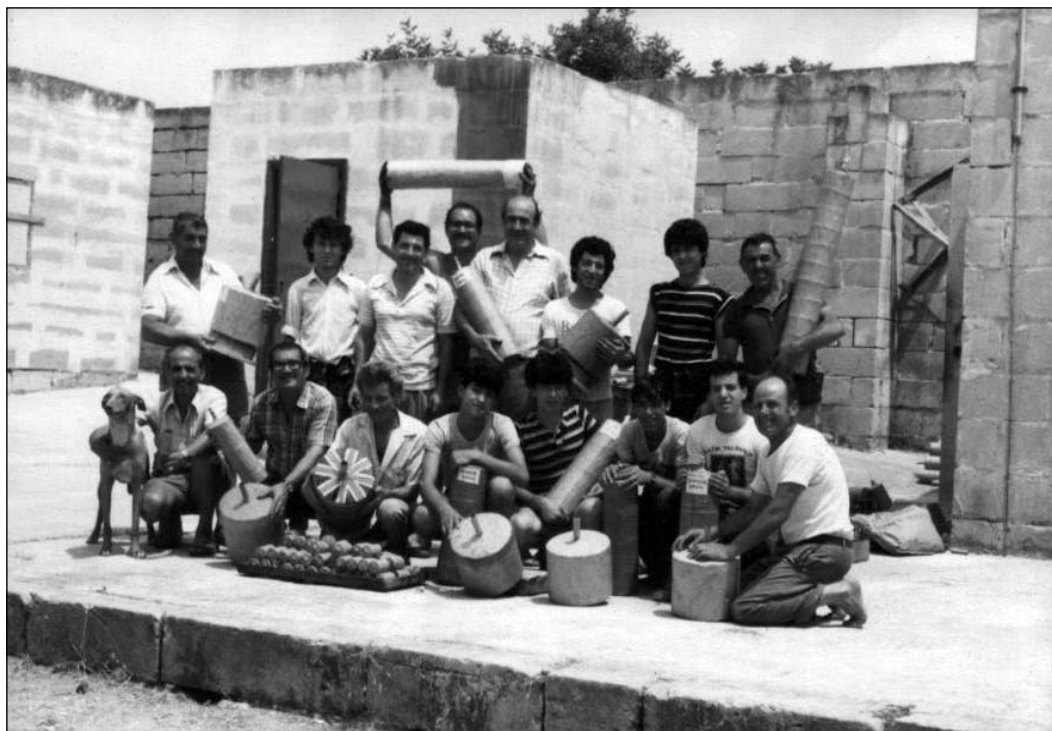
Fit-tmeninijiet, uħud tal-fehma li dawn kienu l-aqwa żminijiet tal-Għaqda tan-nar San Gabriel.