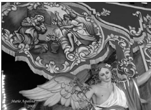
L-armar fit-toroq Balzanin għamel passi kbar 'il quddiem.