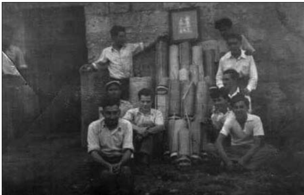
Għall-festa tas-sena 1949 jidher li d-dilettanti tan-Nar Balzanin kellhom Programm imħejji sew għall-festa tal-Lunzjata.