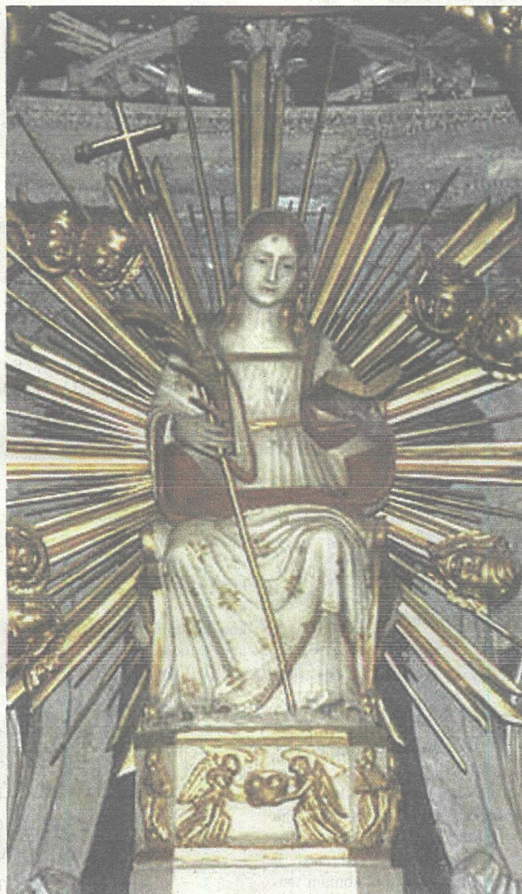
Sant'Agata, qaddisa b'rabtiet speċjali ma' Sqallija... imma anki ma' ġziritna. Din statwa li tinsab fuq l-artal maġġur tal-kappella dedikata lilha fir-Rabat, Malta.

Imma qabel nirakkuntaw din il-ġrajja, tajjeb ngħidu xi haġa dwar min kienet din il-qaddisa. Din Sant'Agata kienet tfajla minn Sqallija, bint in-nobbiltà, li għexet fis-sena 231 A.D. u mietet martri. Dak iż-żmien kienet qed issir persekuzzjoni kbira tal-Insara li kienu jiġu maqbuda, kienu jiġu mġegħlin