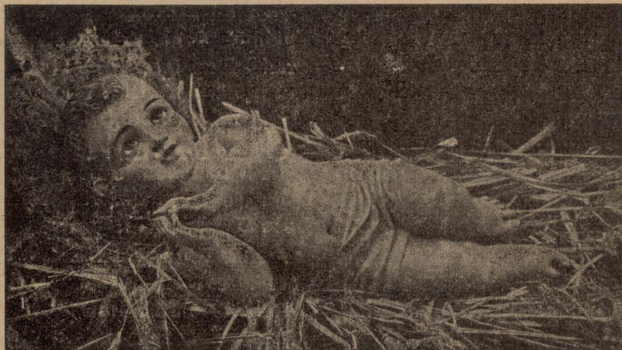
Is-Sura ta' Ġesù Bambin li tittiehed bil-Purċissjoni mill-Knisja tal-Frangiskani għal ġewwa l-Għar tat-Twelid, f'Betlehem.

Sibt ruhi ġewwa l-Għar, ifuh birriha tal-bhur u mdawwal b'għadd kbir ta' lampieri żgħar, homor, kohol, sofor, hodor u minn kull lewn. Qagħadt