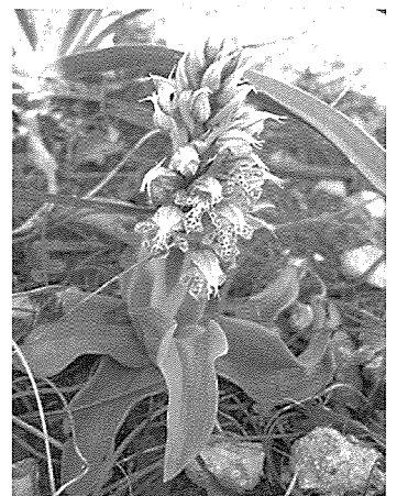
Orchis lactea, imħarsa bl-A. L. 311/2006.

Dan il-wied huwa wkoll karatterizzat minn bosta kmamar mibnija aktarx b'mod illegali biex iservu ta' kenn għal bosta nassaba. Dawn il-kmamar