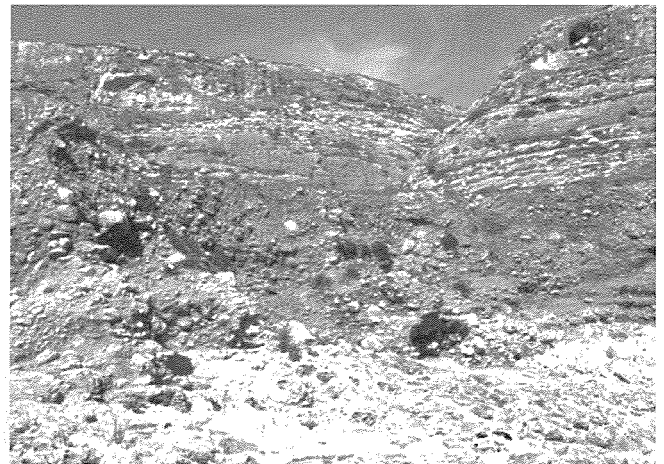
Depożiti Kwaternarji f'Wied il-Maghlaq

l-ilma biss wara xita qawwija. L-ilma jaqsam minn bejn it-tliet barrieri li jiċċirkundaw il-bidu tal-wied u jispiċċa fil-baħar fid-daħla magħrufa bħala l-Maghlaq.