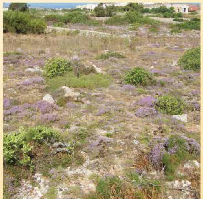
Dan l-artiklu nkteb minn Philip Camilleri, Uffiċjal Xjentifiku fi hdan is-Sezzjoni Regolatorja.

Issa li diħlin fis-sajf propju, meta jkollna temperaturi għoljin u n-nixfa tippersisti, is-sitwazzjoni tkompli teħzien. Xi whud mir-riżultati wiehed jista' jbassarhom, iżda minħabba li xitwa bħal din li kellna hija rari hafna, jista' jkun illi għad irridu niltaqgħu ma' effetti negattivi fil-biedja li qatt ma ltaqajna magħhom qabel.