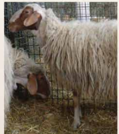
Nagħġa ta' dixxendenza Maltija