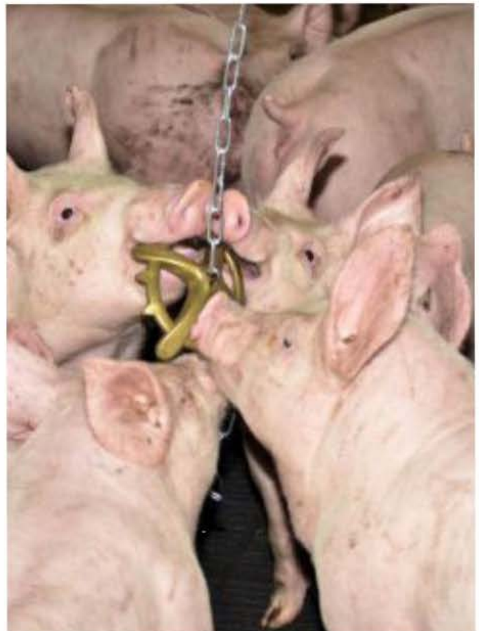
Apparat li jintuża biex l-majjal jigu aljenati milli jigdmu dnieb xulxin

Bħala konklużjoni ta' dan l-artiklu nixtieq li wieħed jifhem li l-bhejjem verament ibagħtu minn stress psikologiku, u aktar ma nipruvwaw ninzlu għall-livel ta' l-annimal inkunu nistgħu nifmuhom aktar u inkunu qed nibbenefikaw kemm aħna u kemm huma.