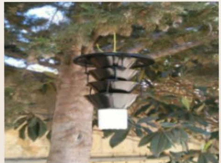
Nassa mdendla ma' siġra taż-żnuber