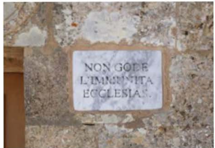
( http://www.wikiwand.com/en/St._Mary_Magdalene_Chapel,_Dingli )

ħafna mill-graffitti huma marbutin mas-settur marittimu u dawn il-bicca kbira huma taħzi jew brix ta' forom ta' xwieni jew iġfna. Dawn huwa maħsub li kienu jsiru minn persuni bħala sinjal ta' ringrazzjament ta' wegħdi li kienu jkunu milqugħa. Dawn l-persuni kienu jkunu nies li ma kienux jifilhu jħallsu biex jagħmlu xi kwadru bħala turija ta' apprezzament u għalhekk kienu jużaw dan il-metodu biex juru l-gratitudni tagħhom.