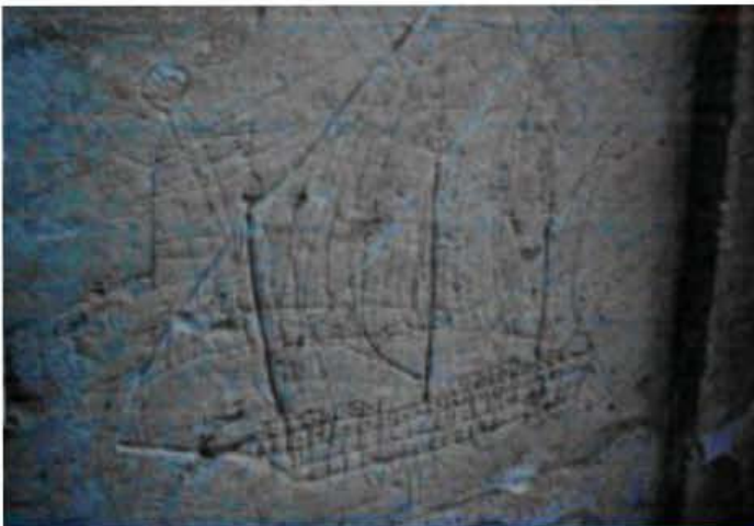
( http://oi.research.um.edu.mt/cms/loikids/lessons/history/lesson2/3.html )

F'din is-sensiela ha nagħtu harsa lejn dawn l-kappelli. Dawn l-kappelli għandhom storja wara kull waħda minnhom u bosta minnhom jmorru lura fil-milja tas-snin. Bosta drabi jsiru bosta mistoqsijiet fuq dawn l-postijiet ta' qima li jinsabu fil-kampanja fejn diversi minnhom huma f'postijiet mwarrba. Mistoqsijiet li jqumu ta spiss huma għaliex hemm dawn l-kappelli meta madwarhom ma hemmx bini, xi whud għandhom taħzi li jissejjah graffiti fuq l-ħitan ta barra, fejn l-bieb whud għandhom tabelli tal-irħam identiċi bil-kliem bit-Taljan: Non Gode l'Immunita Ecclesiastica. Marbutin ma bosta minn dawn l-kappelli hemm ukoll diversi legġendi.