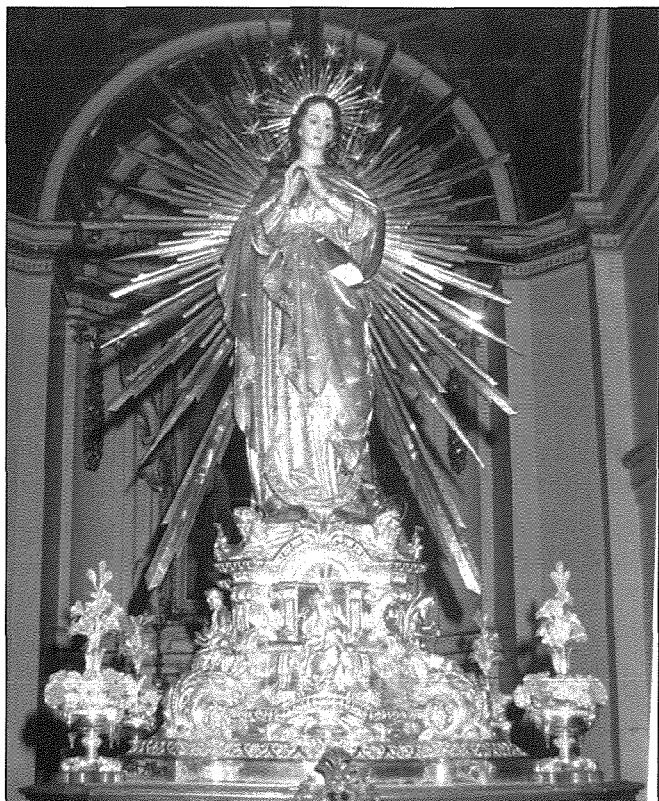
11 ta' Novembru 1994: Il-vara tal-Immakulata Kuncizzjoni fi triqitha lejn il-Bażilika ta' Sant'Elena, għaddeja minn biswit il-Kappella ta' Sant'Antrnin u Santa Katerina, u armata taħt in-ava fil-Bażilika

Għaqda Mużikali Sant' Elena A.D.1919, Birkirkara | Festa 2019