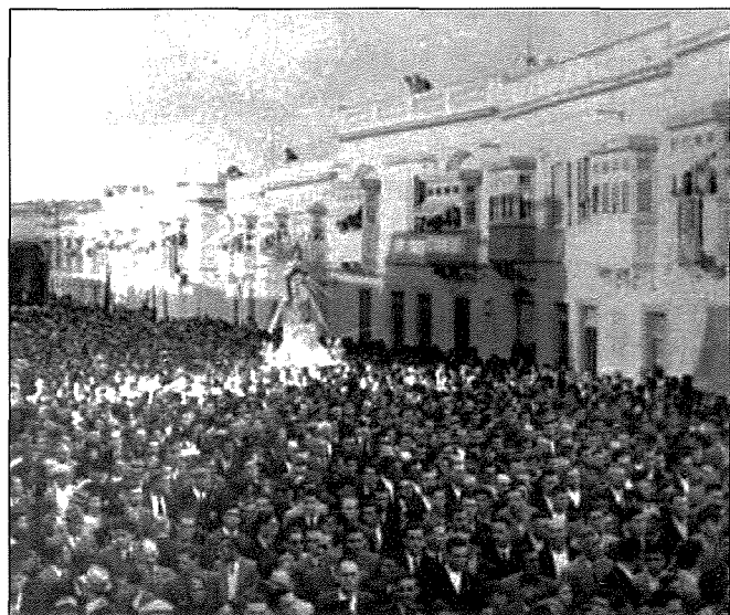
19 ta' Novembru 1944: Il-vara tal-Immakulata Kuncizzjoŋi hierġa mill-Kolleġġjata ta' Sant'Elena u l-baħar ta' nies li akkumpanjaha lura sas-Santwarju tal-Belt Cospicua