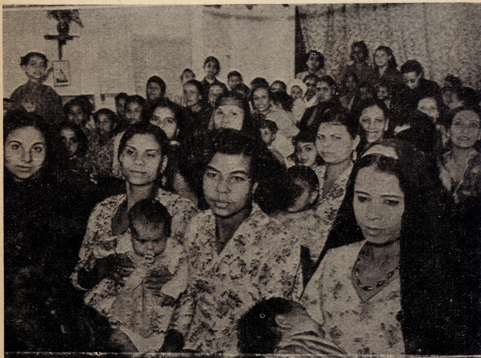
Dawn in-nisa ma jemmnux biż-Żar! Gew huma u ġiebu t-trabi maghhom fl-Ispiżerija tal-Frangiskani, biew jiehdu d-duwa meħtieġa.

Il-bqija tal-iskunġrar sar fit-tielet jum, bil-qari fuq ras it-tifel il-marid