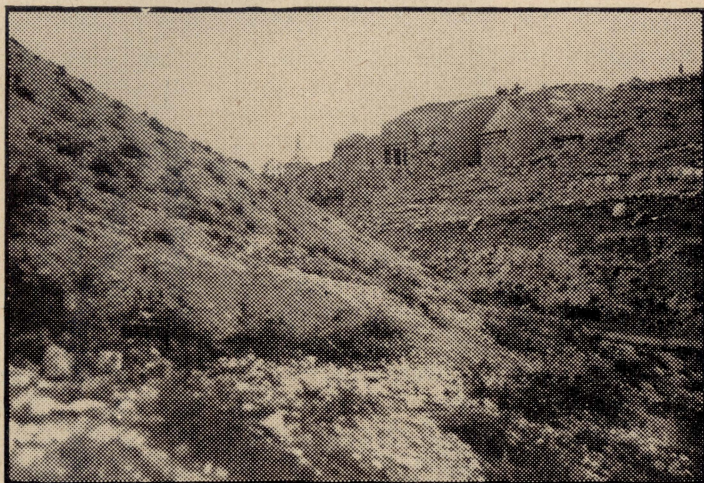
Ġerusa'em, Wied ta' Kedron. Jidhru, fil-bghid, il-qabar ta' Beni-Heżir, u l-Piramda tiegħu, li tahtha kien midfun il-ġisem ta' San Ġakbu.

qal ukoll li San Ġakbu kien midfun qrib it-Tempju fejn kien imħaġġar, u li l-piramda ta' fuq qabru, damet wieqfa hemm sa żmien l-Imperatur Hadrijanu (1). Li qal san Ġormu jiswa hafna, għax minnu jingħaraf li għal habta tas-seklu IV, meta għebet il-piramda ta' taht il-kantuniera tat-Tempju, il-qabar ta' San Ġakbu beda jitwera fil-ġenb l-iehor tal-wied