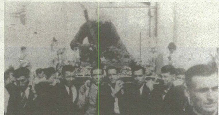
L-istatwa ta' Ġesù Redentur quddiem il-knisja ta' Kristu Re, Raħal Ġdid.