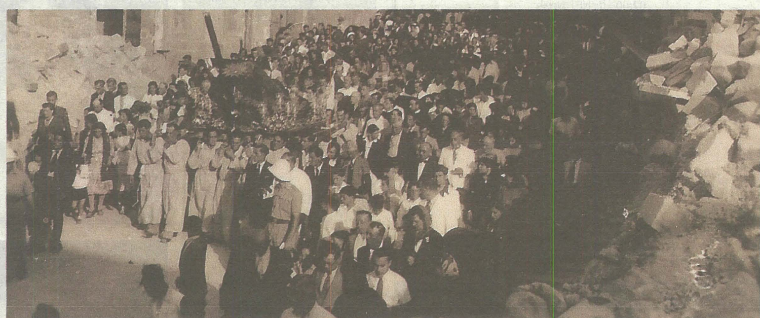
Il-pellegrinaġġ għaddej minn Triq il-Vitorja fl-Isla fit-trieqtu lejn il-knisja ta' San Filippu.