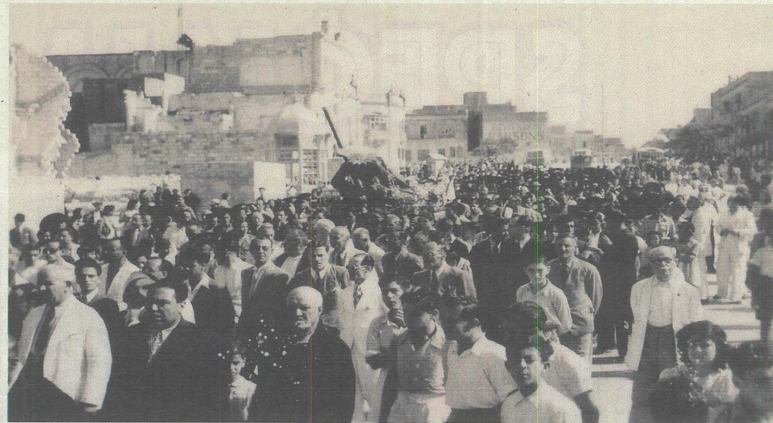
Il-bidu tal-pellegrinaġġ bl-istatwa tar-Redentur fil-pjazza ewlenija ta' Raħal Ġdid.

Gie deċiż li jitnehhew mill-periklu li kienu fih. Immedjatament, fis-17 ta' Jannar, l-istatwa ta' Ġesù Redentur ittieddet fil-knisja Kolleġġjata ta' Sant' Elena f'Birkirkara u, f'it tal-jiem wara, ittieddet ukoll l-istatw tal-Bambina. Hemm baqghu sa tmien il-gwerra. Wara dawn,