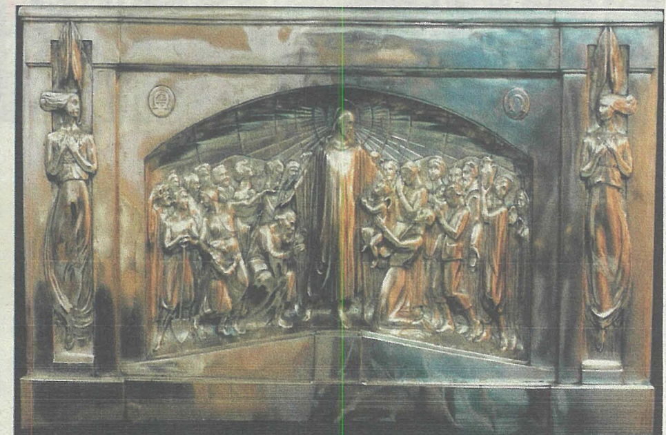
Il-ventartal tal-fidda li sar fl-1953 għall-artal ta' Ġesù Redentur.