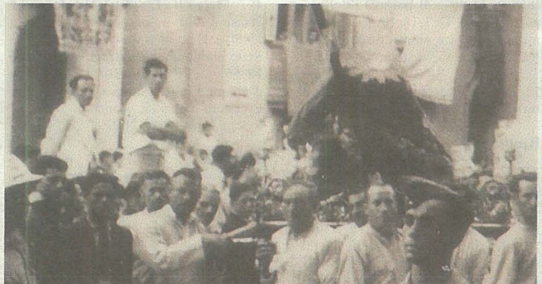
Il-wasla tal-istatwa tar-Redentur fuq iz-zuntier tal-knisja ta' San Filippu.

ra, saru x-xoghlijiet ta' rikostruzzjoni meħtieġa fl-Oratorju tal-Kurċifiss li wkoll ġarrab hsarat tul il-gwerra. Meta dawn tlestew fl-1947, l-istatwa tar-Redentur reġgħet lura f'postha. Dak iż-żmien, saru wkoll xi dekorazzjonijiet. Fost dawn kien hemm il-ventartal tal-fidda għall-artal tar-Redentur biex jintuza tal-irham għan-niċċa. Il-ventartal, iddisinjat minn Antonio Sciortino fl-1938, gie ordnat għand id-Ditta Battaglia ta' Milan u tlesta fl-1953, fitwaqt li f'Ġunju 1957, il-Kurja tat il-permessi meħtieġa biex il-faċċata tan-niċċa tinkesa bl-irham u tlestiet is-sena ta' wara.