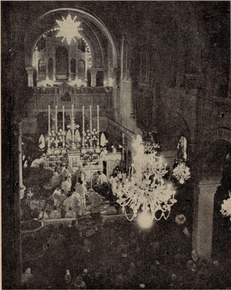
Betlehem — FEJN ISSIR IT-TIFKIRA. L-artal il-Kbir tal-Knisja ta' Santa Katarina, qrib il-Ghar ta' Betlehem, waqt il-Quddiesa ta' Nofs il-lejl tal-Milied.

hem* fiċ-ċerimonja. Ma' nofs il-lejl tibda l-quddiesa l-kbira, u m a l l i l-Patrijarka jkanta l- Glorja , tixghel kewba kbira fil-gholi, imdendla mas-saqaf tal-knisja, u fuq l-artal jinkixef hlewwa ta' Bambin. Bambin mimdud fuq marqad tad-deheb, rasu mitkija fuq imhadda tal-harir abjad, imbissem, u fuq wiċċu dehra tal-