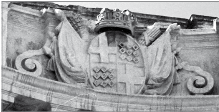
Dettall mill-funtana ta' Pjazza San Ġorġ Valletta

Iċ-ċerimonja tal-inawgurazzjoni ta' din l-arkata saret f'jum San Filep, fit-12 ta' Mejju 1798, meta l-Gran Mastru De Rohan kien ilu mejjet qrib sena. Dawn iż-żewġ Gran Mastri, de Rohan u Von