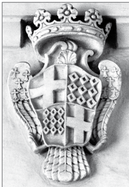
Skultura bl-emblema ta' De Rohan

Il-mewt tal-Gran Mastru De Rohan qanqlet fil-qlub taż-Żebbuġin, dik it-turija kbira ta' rispett u rikonoxximent u xejn ma naqqas l-isforzi biex tinżamm dik il-wegħda li kienu ntrabtu biha iż-Żebbuġin fil-1777: dik tal-bini taż-żewġ arkati trijonfali (il-bieb fid-daħla tal-belt). Miż-żewġ arkati li kellhom jinbnew, waħda biss tlestiet u din giet inawgurata mis-suċċessur tal-Gran Mastru De Rohan, Fra Ferdinando Von Hompesh zu Bolheim, elett Gran Mastru