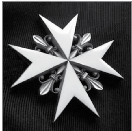
Is-salib ta' tmien ponot