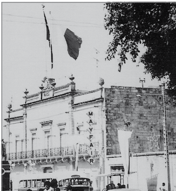
Ritratt meħud fis-snin sebgħin. It-Tabella b'isem iç-ċinema Mayfair tidher mal-faccata tal-każin eżatt hdejn il-bieb żgħir tad-dhul għaç-ċinema. Din it-tabella tneħhiet fl-2000.

Il-posters fil-bidu kienu jitwaħhlu fuq tilari għoljin sitt piedi 2 . Mal-posters li kienu ta' qies kwadru, kienu jitwaħhlu wkoll bil-pins il- Lobby Cards li huma ritratti meħudin mill-