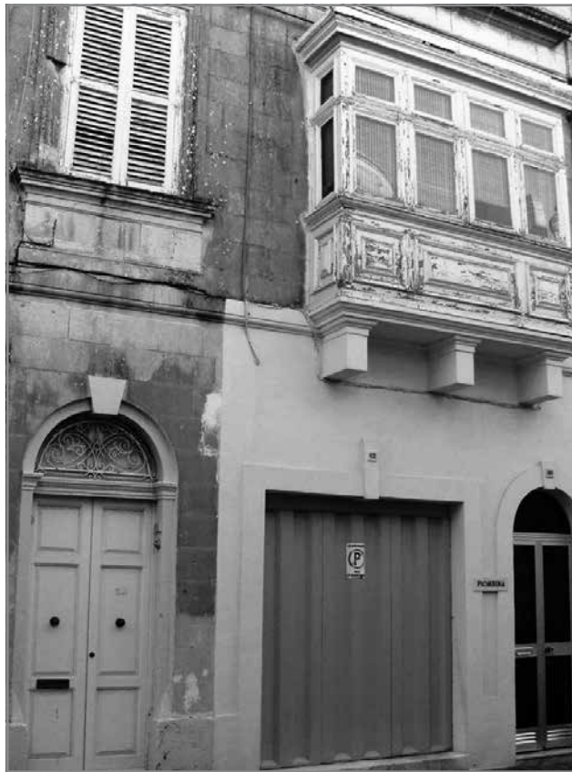
Id-dar N° 64, Triq L-Isqof Caruana, fejn kien joqgħod is-Surmast Gatt