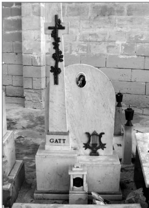
Il-qabar tal-familja Gatt

Ħaġa oħra ta' min isemmi hi li meta Mro Adeodato kien jidderieġi l-Banda, f'daqqa waħda kien idur għal fuq in-nies preżenti li jkunu qed jarawh u jgħiegħel lill-poplu jakkumpanja billi jkanta l-versi