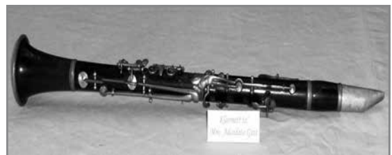
Il-panju u l-klarinetta tas-Surmast Adeodato Gatt li qegħdin iżejnu s-Sala tal-Arkivju tal-Każin Banda San Filep