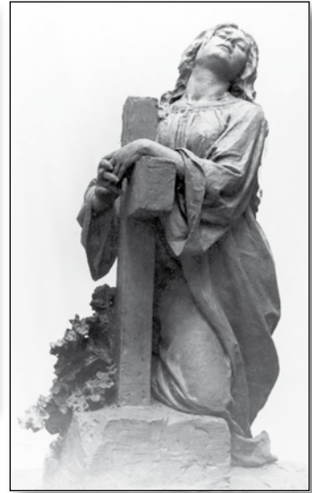
Uħud mix-xogħlijiet tal-artist Sciortino