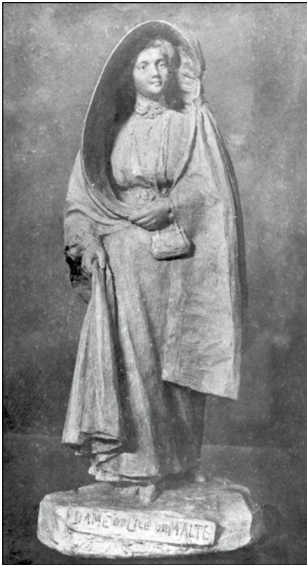
Ghonnella – Il-Mara Maltija