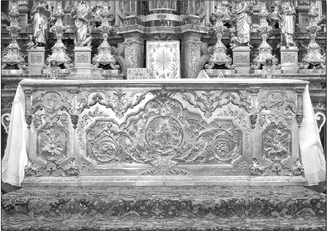
Il-Ventartal tal-Maġġur ta' San Filep Haż-Żebbuġ

Fis-sena 1904 Sciortino ġie kummissjonat li jimmodifika l-faċċata tal-knisja tan-Nadur f'Għawdex li kienet novità kemm għal dak li huwa disinn kif ukoll għal mod strutturali li bħala perit adatta fejn haddiehor ma wasalx, biex jipprova xjenza ġdida dwar il-piż li kapaċi tiflaħ arkata.