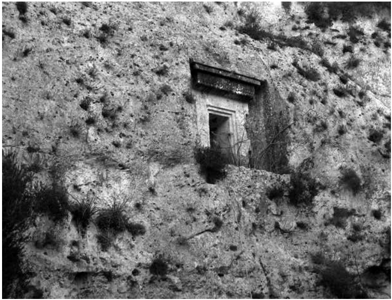
Il-qabar magħruf bħala tal-Ingliża, f'Wied Qirda, Haż-Żebbuġ.