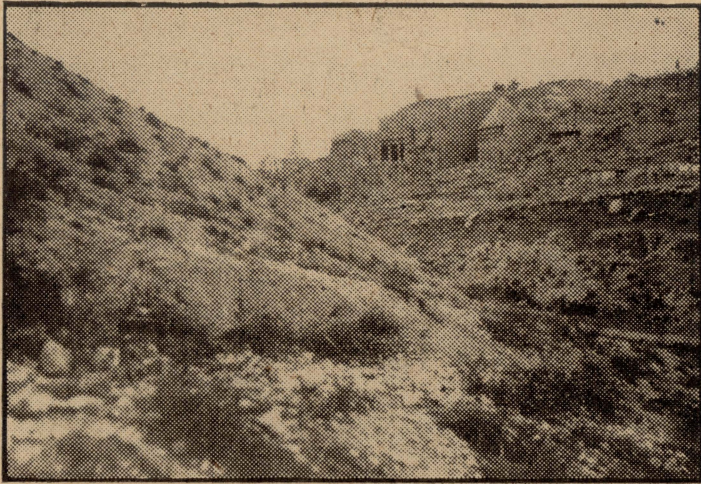
Il-Wied ta' Gosafat. Jidhru wkoll l-oqbra maqtughin fil-blat, imsemmija fix-xbiha l-oħra.

Fih bħal kolonni u gwarniċ, minquxin minnu fih, u fuq il-gwarniċ, saff haġar kbir, mingur u mmelles, inqiegħed bla tajn, iżomm shih bit-toqol tiegħu n-nifsu. Fuq dan hemm bħal lenbût wiċċu 'l isfel, tal-haġar kbir u mieles ukoll, u fiż-żennuna tal-lenbut, troffa weraq tal-palm, kollox tal-haġar. Dan il-mawsulew, hadd ma jaf sew min bnieh; kien jinsab hemm fi żmien Jûsef il-Lhudi (Josephus Flavius), li jsemmih Jâd Ab-Xalôm , għal hekk għandna naħsbu li kien hemm fi żmien