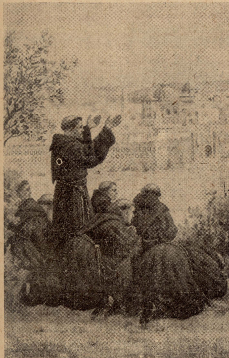
San Frangisk jasal Ġerusalem.

Kienu jmorru jghinu lin-nies jaħdmu fir-raba: jagħzqu u jizirghu; jaħdsu u jidirsu u dan. Jew iduru bil-morda u