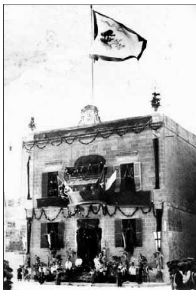
Il-kazin imzejjien għall-festa, kif kien jidher sal-bidu tas-snin hamsin.