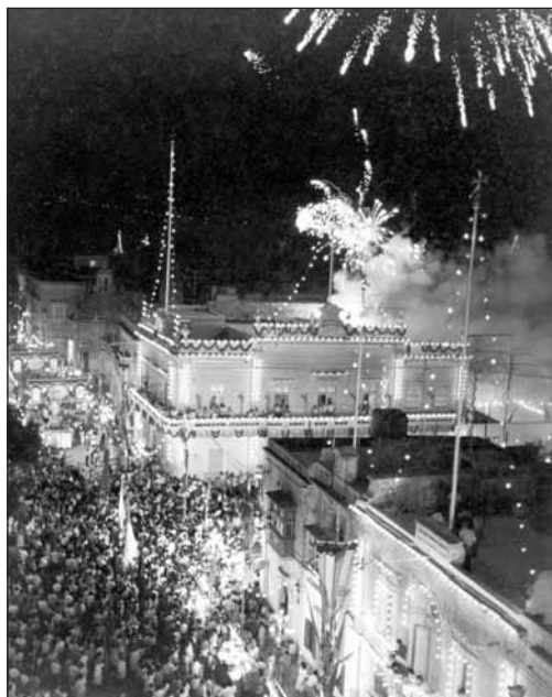
Il-binja tal-każin kif kienet fis-snin tmenin