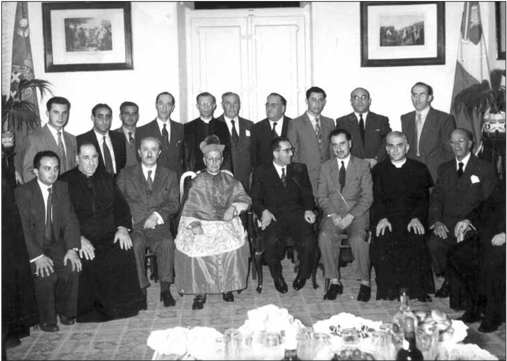
Il-Prim Ministru Dom Mintoff u l-Arċisqof Mikiel Gonzi mal-Kumitat u l-Arċipriet Lawrenz Zammit fl-okkażjoni tal-inawgurazzjoni tal-bini mill-ġdid tal-każin f'Novembru 1955

ewwel estensjoni tal-bini tal-każin, ftit wara li kienet infetħet Triq Sciortino. Fl-1962 irtira minn surmast direttur wara li ħalla ħafna xogħol mużikali lill-Filarmonika San Filep. Surmast li ismu ma jista' jintesa' qatt għall-bosta marċi sbieħ li kiteb u li ħafna minnhom għadhom popolari sal-lum. Fosthom insemmu l-innu u marċ meraviġjuż "Lir-Rebbiegħ ta' Aġġira" (1947), "Ferhanin" (Joyful Day 1949), "F'Misraħ San Filep" (1954) u naturalment l-"Innu tal-Banda" (1928).