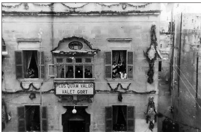
Il-faċċata tal-każin kif intramat għall-okkażjoni taż-żjara tal-Gvernatur Lord Gort fl-1944

fid-dar Numru 273 u 274 (illum Francois ) fi Strada Reale. Wara li s-soċi u l-bandisti rranġaw id-dar u marru go fiha għamlu l-ftuħ tagħha bi programm mużikali li għbed ħafna nies lejn dan il-każin. Iċċelebraw il-festa ta' San Filep b'solennità kbira u ftit tal-gimghat wara, il-Banda Mużikali San Filippu kompliet ferhet liż-Żebbuġin billi wettqet żewġ servizzi mużikali għall-okkażjoni tal-festa tal- Beata Vergine taħt it-titlu tal-Karità.