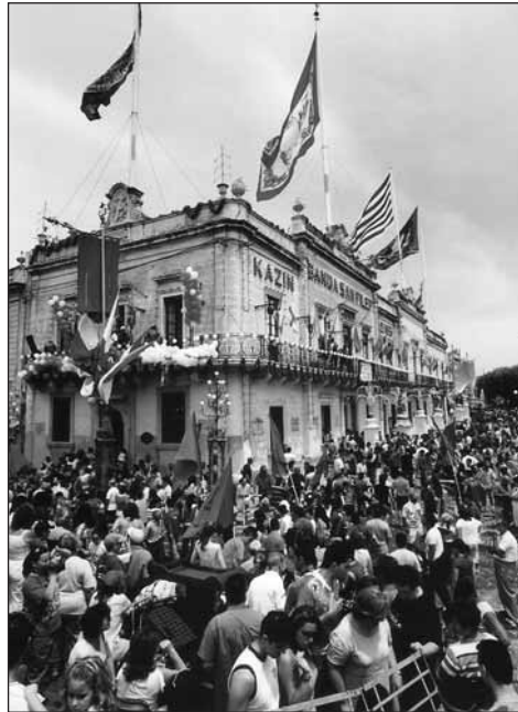
Dehra riċenti tal-każin waqt il-marċ ta' filgħodu