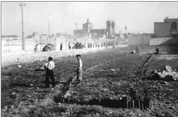
Kien jinharq in-nar tal-ajru mill-għelieqi f’nofs ir-raħal – illum Triq Sciortino