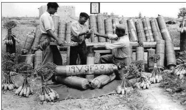
Fini fix-xogħol tan-nar... fini fil-poża għar-ritratt

Il-gazzetta Il-Habbar tal-Ħamis 31 ta’ Mejju 1894 irraportat hekk: “Il-festa tal-Protettur u Tawmaturgu San Filippo t’Aġġira saret fil-21 ta’ Mejju. Iġ-ġigġifogijiet kienu ta’