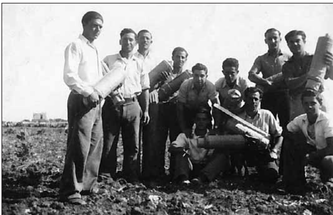
Grupp numeruż ta' dilettanti tan-nar f'nofs is-seklu għoxrin