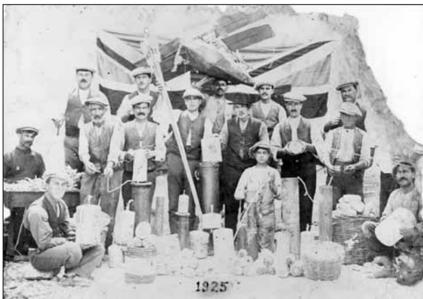
Grupp li fl-1925 kien jaħdem in-nar fis-St. Philip Fireworks Factory li kienet ġiet liċenzjata fl-1920

Nistgħu ngħidu li mat-tmiem tal-bini tal-knisja, bdiet issir festa devozzjonali lil San Filippu t'Aggira. Il-ħgejjeg li kienu jitqabdu biex idawlu u jsebbħu l-ambjent flimkien mal-istakkament Żebbuġi tad-dejma taw sehem biex isebbħuha. Huma kienu jikkargaw il-