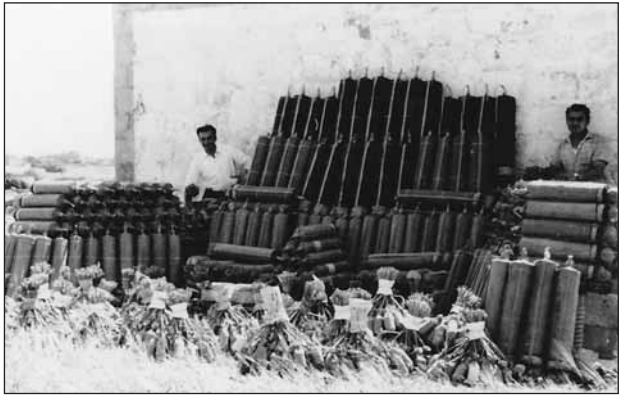
Il-kamra tan-nar ta' San Filep ilha magħrufa għall-murtali tal-kulur u l-murtaletti

Dan kien ġara għax kien insteraq nar ta' xi individwu u mhux ta' oħrajn u donnu min seraq kien għaraf jagħżel. Ġurnata fost l-oħrajn, waqt li kienu qed jaħdmu fil-kamra, semgħu prova ta' murtal u din ħassbithom. Dan kien ġie nmutat mid-dilettanti tan-nar u għalhekk qablu li setgħet kienet saret serqa minn xi barranin. B'xorti tajba, min kien għamel is-serqa kienu individwi mingħajr esperjenza u meta ġew biex jagħmlu l-provi tan-nar dawn ma sarux mill-