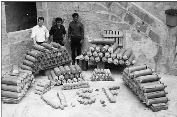
Xogħol tan-nar maħdum f'Gianpula

Billi issa l-kumitat tal-festa kien inħatar, il-kummissjoni li kellha tirrappreżenta lis-Socjetà mal-arċipriet fuq l-istess sugġett giet magħmula minn membri tal-kumitat eżekuttiv u mill-kumitat tal-festa. Il-laqgħa kienet saret nhar it-Tnejn 5 ta' Awwissu 1957. Fis-seduta ta' nhar it-Tlieta 6 ta' Awwissu 1957, il-president għarraf lill-kumitat li "L-arċipriet aċċetta li l-kmamar jinbnew fl-istess post fejn kienu imma l-kumitat irid jiehu ħsieb iġib