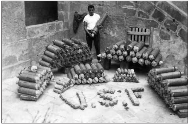
Aktar nar f'Gianpula

Dan kien ġara fl-ewwel Gimgha tax-xahar t'Ottubru 1982 permezz ta' ittra ufficjali minghand il-Kummissarju tal-Pulizija li ġgib id-data tat-8 ta' Ottubru fejn il-kumitat tal-Kazin San Filep gie mgħarraf bid-deċiżjoni tal-Pulizija li ma ġgeddidx il-permess għal xogħol tan-nar fil-kamra tan-nar tal-Kandlora. Għalhekk il-Kazin Banda San Filep kellu