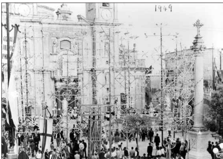
Nar tal-art armat fil-pjazza ta' Haż-Żebbuġ f'nofs is-seklu għoxrin

Kien matul il-ħakma tal-Ordni f'Malta li daħlet l-użanza ta' musketterija magħmulabl-użatal-maskli. Dawn il-maskli kienu blokki tawwalin tal-ħadid b'toqba fin-nofs għall-porvli u oħra rqiqa li tinfed mill-ġenb għan-niċċa. Kien hemm ukoll maskli kbar bil-widna li kienu tal-bronż 4 u li kienu jagħmlu ħoss daqs murtal tal-bomba. La jimtlew bil-