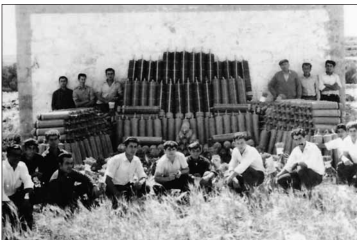
Grupp kbir ta' dilettanti tan-nar fil-kamra tal-Kandlora

filgħaxija meta għamilthom taħt abti ta' kull naħa u għbidt għal Hal Dwin biex qbadt Triq Hali għal fejn il-Knisja tal-Angli. Tlajt minn Triq l-Anglu għal wara l-Parroċċa (it-Tribuna) għal quddiem fejn hemm id-Domus. Qbadt is-sqaq li kien iwassal sal-għalqa tal-ħruq. Din l-għalqa llum hi mibdula mir-roundabout ta' Triq Antonio Sciortino. Kif wasalt u poġġejthom hdejn il-murtali l-oħrajn ħadt nifs qawwi u rringrazzajt lil San Filep li d-dmir tiegħi kont wettaqtu sew. Niringrazzja lil Alla li f'dak il-ħin ftit li xejn kont iltqajt ma' nies għax kien ħin li l-folol kien jkunu l-knisja jew wara l-marċi. Ngħid il-verità kont attent li ma jersaqx xi ħadd b'xi sigarett fuqi u ntajru kollox."