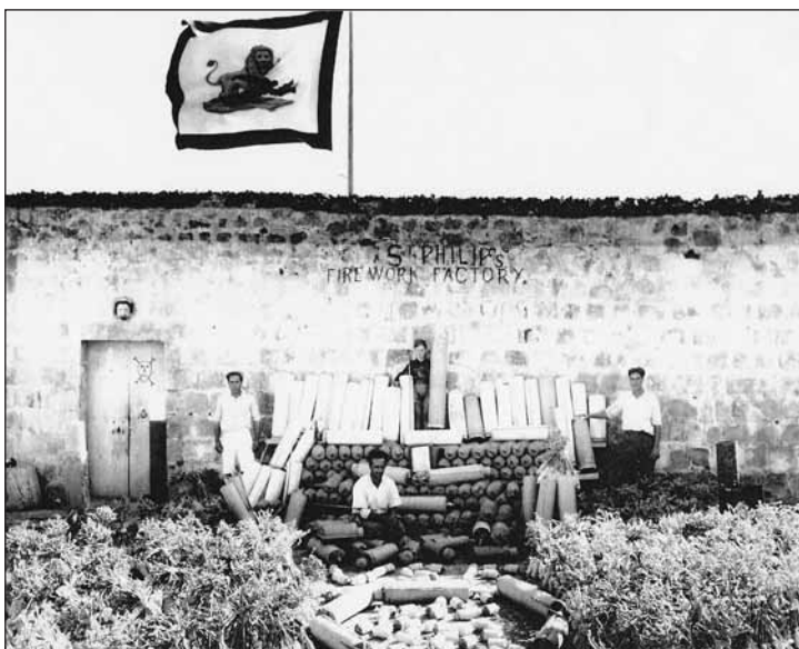
Il-Bandiera tal-Iljun kienet spiss tperper fuq il-kamra tan-nar ta' San Filep