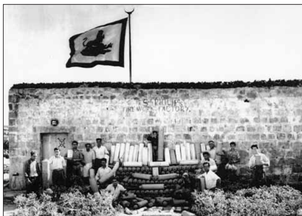
Grupp tan-nar fis-snin hamsin tas-seklu għoxrin, fil-kamra tan-nar tal-Kandlora

Fis-sena 1811, l-ispiza tal-logħob tan-nar laħqet il-45 skud. Fi snin oħra ġieli thallsu fuq 75 skud bejn xogħol u materja. Dawn l-ispejjes kienu jinqasmu prinċipalment fi tlieta: Fuoco Artificiale li kien jikkonsisti fil-logħob tan-nar tal-art. Dak iż-żmien dan kien statiku u mhux