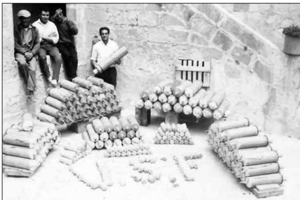
Nar tal-ajru f'Gianpula