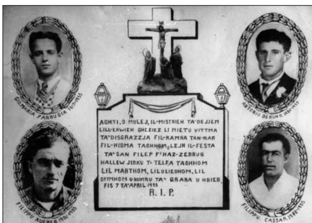
L-Erba' vittmi tat-traġedja tal-1955

Dan kellu jġiri għax il-kumitat ta' din is-Socjetà kellu f'moħħu li mal-festa tas-sena 1955 jinawgura l-estensjoni tal-bini l-ġdid tal-Każin Banda San Filep.