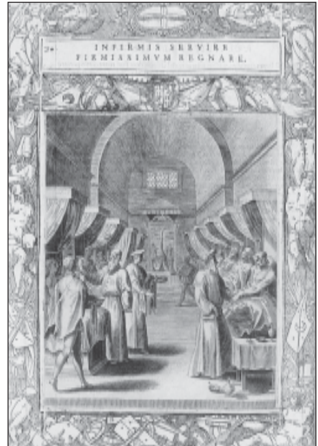
Fig. 1. Inciżjoni mill-ktieb Statuta Hospitalis Hierusalem ta' l-1588 li tagħti dehra tad-dormitorju tas- Sacra Infermeria fi żmien il-G.M. Verdala (1581-1595)