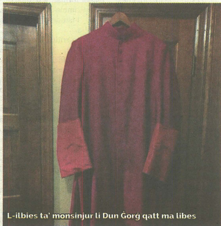
L-ilbies ta' monsinjur li Dun Ġorġ qatt ma libes

F'dawn l-aħħar snin, fil-Knisja Maltija qegħdin naraw ruxxmata titli godda lil