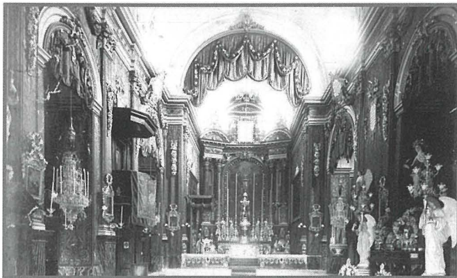
Il-Knisja armata għall-Festa ta' Santa Tereża. Din is-sena l-istatwa kienet intramat fuq il-Bankun tal-Kuncizzjoni