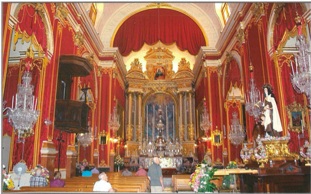
Is-sena 2015. Din is-sena l-artal maġġur kien armat bl-apparat tal-fidda tal-Festa tal-Kunċizzjoni. Tidher ukoll l-istatwa ta' Santa Tereża armata fuq il-Pedestall ta' San Ġużepp u l-Bankun tiegħu

Wara l-gwerra is-sitwazzjoni nbidlet. Għall-okkażjoni taċ-Ċentinarji tal-1951 u l-1961, il-kapitlu ddeċieda li jsellef l-oġġetti prezzjużi lil Santa Tereża bħal ventartal il-lampier u oġġetti oħra, għall-fatt li f' dak iż-żmien Santa Tereża kellha s-support ta' hafna min-nies ta' Bormla, il-kapitlu beża' li f' Santa Tereża jibdew isiru oġġetti prezzjużi li jikkompetu