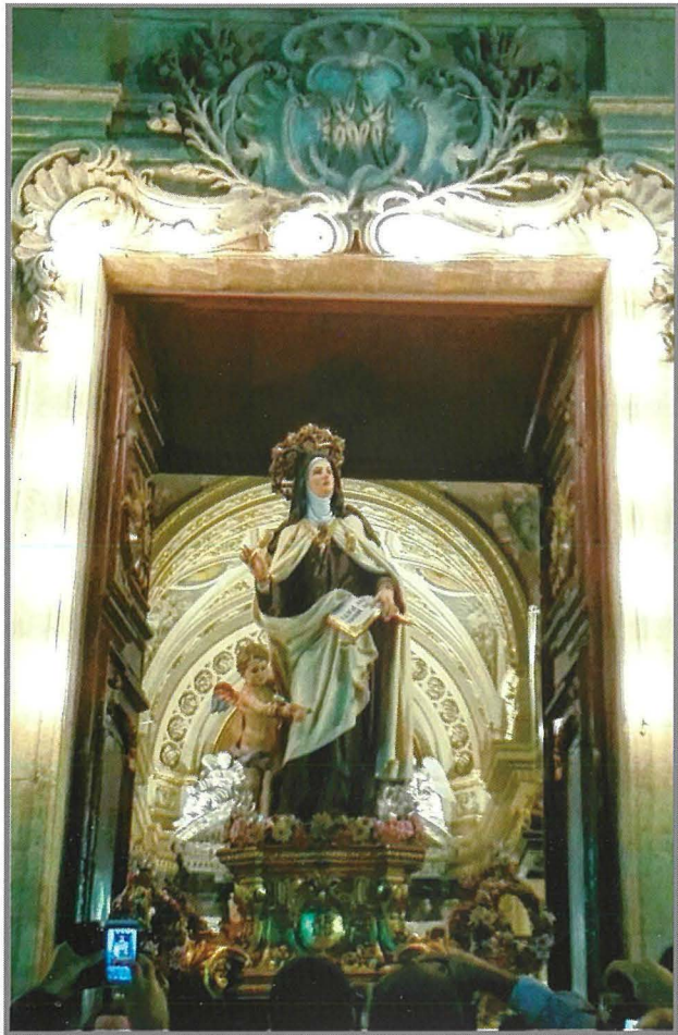
Santa Tereża ħierġa mill-Kolleġġjata ta' Bormla