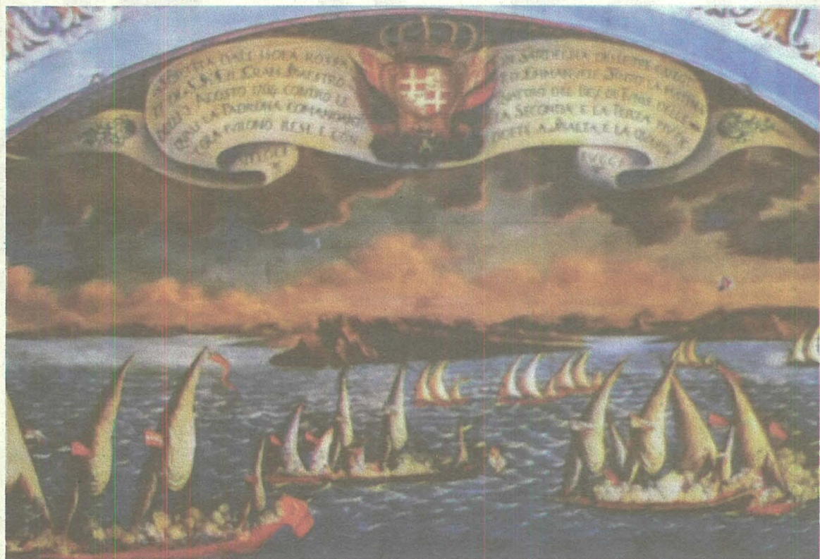
Il-Kursari tal-Prinċep ta' Malta fl-azzjoni. Waħda mil-lunetti fil-Palazz tal-Gran Mastri l-Belt Valletta. Anonima ċ 1764. Żejt fuq il-canvas.

Dan il-qlib li qed issemmi seħh fil-bidu tas-seklu 17, għax ir-