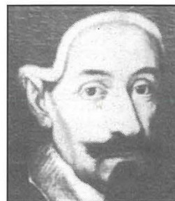
Mons. Fabio Chigi

L-ewwel ġebbla tqieghdet fit-30 ta' Diċembru 1638 fuq il-Gholja ta' Santa Margerita jew il-Madra, kif antikament kienet maghrufa popolarment. 2 Dak kien żmien meta b'mexxej il-Knisja Maltija kellha lill-Isqof Balaguer u b'Inkwizitur kellha lil Mons. Fabio Chigi u l-Ordni kellu b'Sultan tieghu lil Lascaris. Tkompla fl-1698 mill-Gran Mastro Perellos u ntemm mis-Sultan Anton Manwel Vilhena. Dan il-bini kien ikun interott diversi drabi kemm htija ta' nuqqas ta' fondi kif ukoll sabiex jitkomplew swar ohra f'Malta, bhas-swar tal-Furjana.