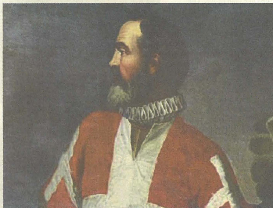
Il-Gran Mastru Jean Parisot de Valette, li kien fiż-żmien li hu kien Gran Mastru li sehħ l-Assedju tal-1565

skriżżjonijiet żgħar magħhom li kienu jagħtu tifsira taċ-ċaqliq tal-qawwiet Torok u anke tal-istrategiji li kienu qed jużaw il-Kavallieri biex jiddefendu l-gżejjer Maltin, b'mod partikulari l-inhawi ta' madwar il-Port il-Kbir. Dawn il-mapep illum huma parti mill-wirt kulturali ta' pajjiżna għax l-ewwel u qabel kollox juru episodju importanti hafna fl-istorja ta' pajjiżna, u t-tieni għax juru aspetti naturali ta' pajjiżna li llum spiċċaw għalkollox. Dawn l-ncizjonijiet huma episodju mill-istorja ta' pajjiżna miktuba 'in real time' . Dawn l-erba' mapep tal-Assedju l-Kbir li kienu għall-wiri fil-Mużew Nazzjonali tal-Arkeoloġija ġew prodott f'Venezja mill-pubblikatur u negozjant tal-kotba u l-mapep Giovanni Francesco Camocio. Tlieta minn dawn il-mapep li huma originali huma proprjetà tal-Mużew Nazzjonali tal-