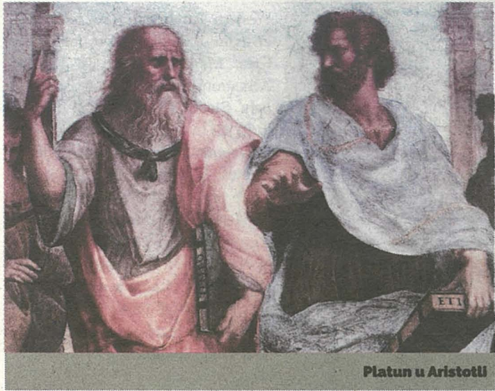
Platon u Aristotill

D iversi kittieba kitbu dwar il-gzira ta' Atlantis u dwar l-istorja tal-poplu tagħha. Insibu għadd gmielu ta' kittieba antiki bħal Diodorus, Kantor, Marcellinus, Plutarch u Herodorus jikkellmu dwarha kif ukoll kitbiet antiki oħra aktarx miktuba mill-Aztec u l-Incas li jikkellmu wkoll dwar l-eżistenza tagħha.