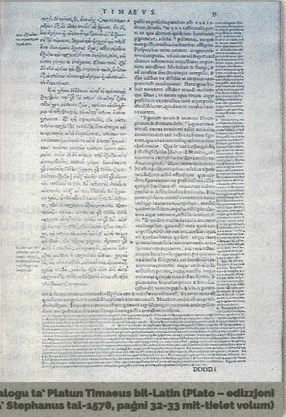
Passaġġ mid-djalogu ta' Platon Timaeus lil-Latin (Plato - edizzjoni ta' Stephanus tal-1576, paġni 32-33 mit-tielet volum)