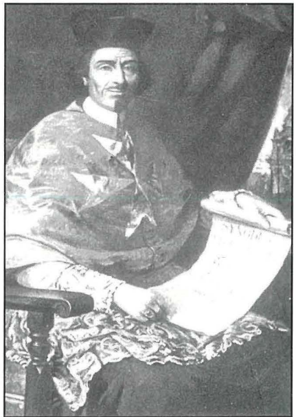
Fra Davide Cocco Palmieri

Fl-1693 iddahhlu xi eżamijiet u fl-1703 meta twaqqaf is-seminarju nhasset aktar il-htieġa ta' ghalliema awtorizzati. Issa hadd ma seta' jghallmew jew jiftah skola bla permess ta' l-Isqof Fra Davide Cocco Palmieri nnifsu, u l-ghalliema bdew jiġu eżaminati minn persuni magħżula, fosthom Patrijiet Ġiżwiti. 7 Fl-istess snin kien hawn il-Kulleġġ tal-Ġiżwiti u eqdem minnu l-iskola tal-Muniċipju fl-Imdina. 8 Kollox ma' kollox, dan ghen biex ikun hemm ghalliema ta' livell sakemm fl-1713 beda jsir eżami pubbliku biex jintgħażlu ghalliema. 9 Bejn l-1757 u l-1758 għal xi żmien reġa' ntelaq kollox u fin-nuqqas ta' isqof inghataw permessi bla ma saru eżamijiet. Il-permessi kienu jinkludu l-parroċċa fejn wiehed għandu jghallmew u x'jghallmew, b'eċċezzjonijiet, restrizzjonijiet u ż-żmien tal-permess.