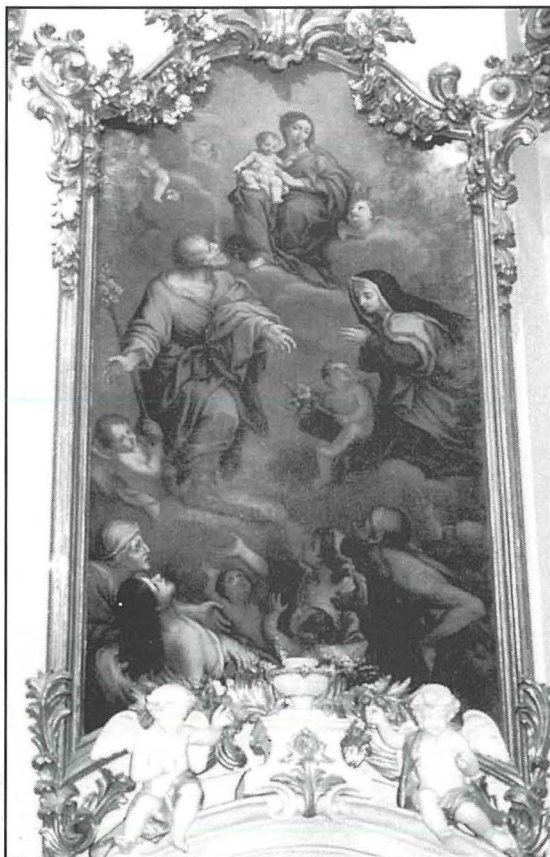
Pittura fuq wieħed mill-bibien għas-sagrġistja.

Fiċ-ċert madanakollu hija l-hidma artistika li saret fl-1767 ġewwa x-