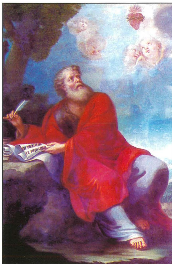
Il-pittura ta' l-artal ta' San Mark