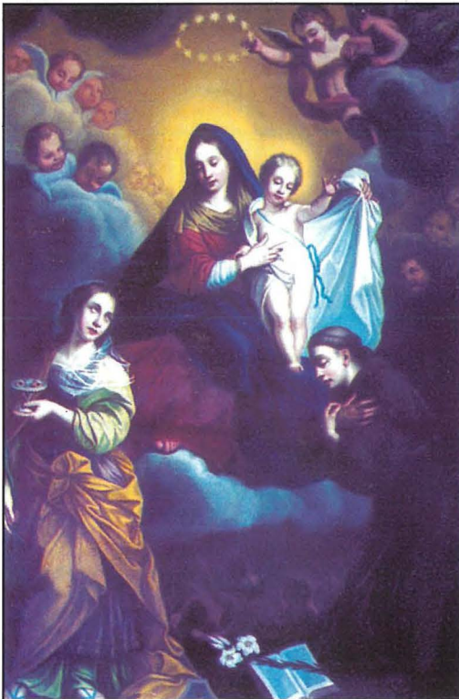
Pittura ta' fejn kien hemm l-artal tal-Grazzja

San Ġużepp jirrappreżenta l-Patroċinju ta' San Ġużepp bhala l-patrun ta' l-Agonizzanti. San Ġużepp jidher qed jirrikmanda lill-Madonna bil-Bambin, moribond u ohrajn. Naraw ukoll qaddisin u persunaġġi ohra. Il-kwadru l-iehor jirrappreżenta t-thabbira li l-Arkanġlu Gabriel (b'ġilju abjad, simbolu tas-safa f'idu x-xellugija) għamel lil Sidtna Marija li kellha tkun Omm Alla, (l-Ewwel Misteru tal-Ferh tar-Rużarju). Naraw ukoll anġlu iehor b'idejh miġburin flimkien jagħti qima lil Marija f'dak il-waqt qaddis. Il-missier etern u xi puttini jimlew il-parti ta' fuq tal-kwadru.