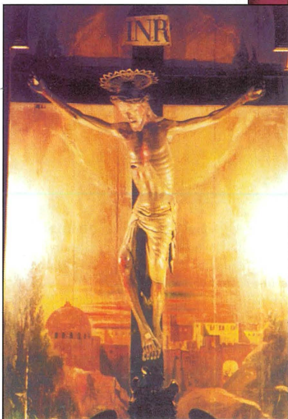
Il-Kurċifiss storiku ta' Kandja