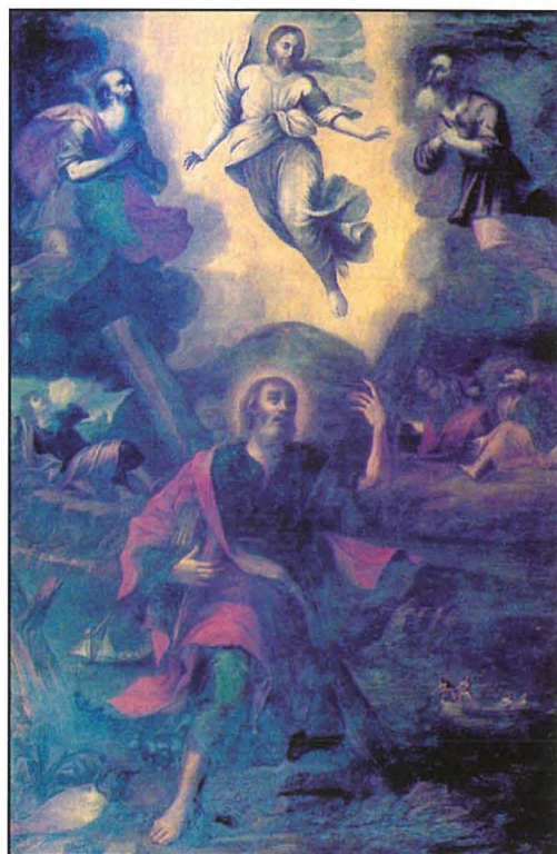
Il-pittura ta' l-artal ta' Sant'Andrija