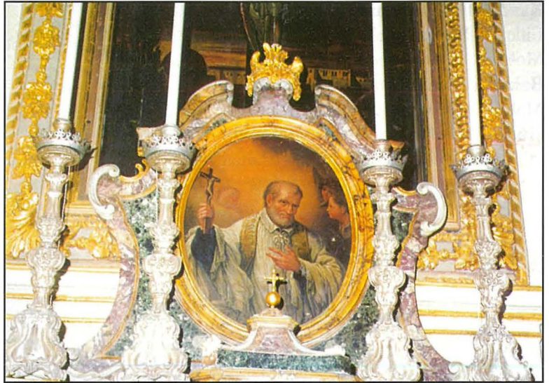
Il-pittura ta' San Vinċenz de Paul li kienet fuq l-artal tal-Kurċifiss