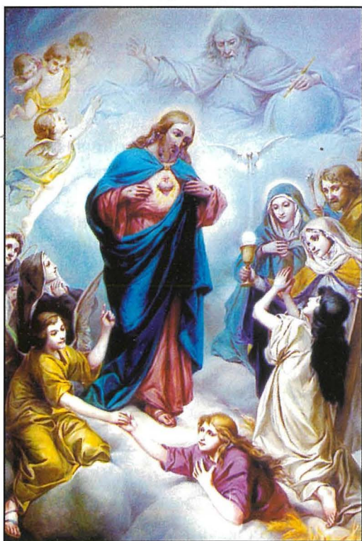
Il-pittura ta' l-artal ta' l-Erwieħ