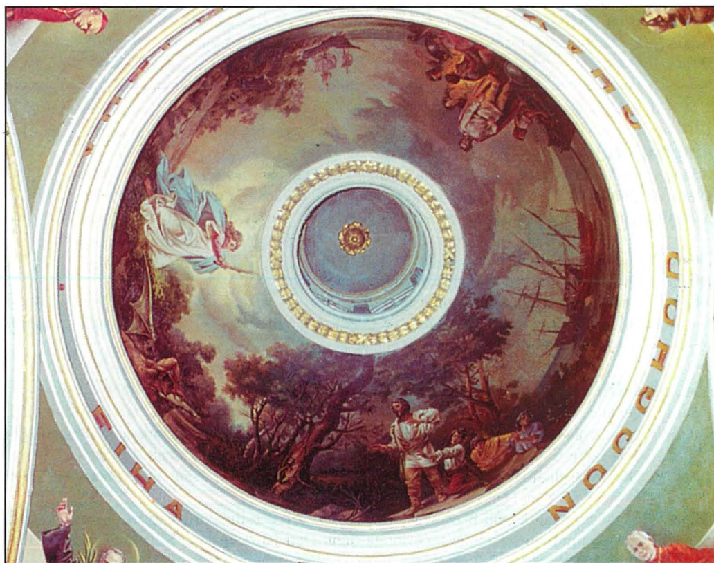
Il-koppletta tal-kappella tal-Madonna tal-Grazzja fejn illum tinsab in-niċċa tal-vara tal-Kunċizzjoni, xogħol Pawlu Camilleri Cauchi. Din il-pittura tirrappreżenta l-leġġenda tal-marżappa.