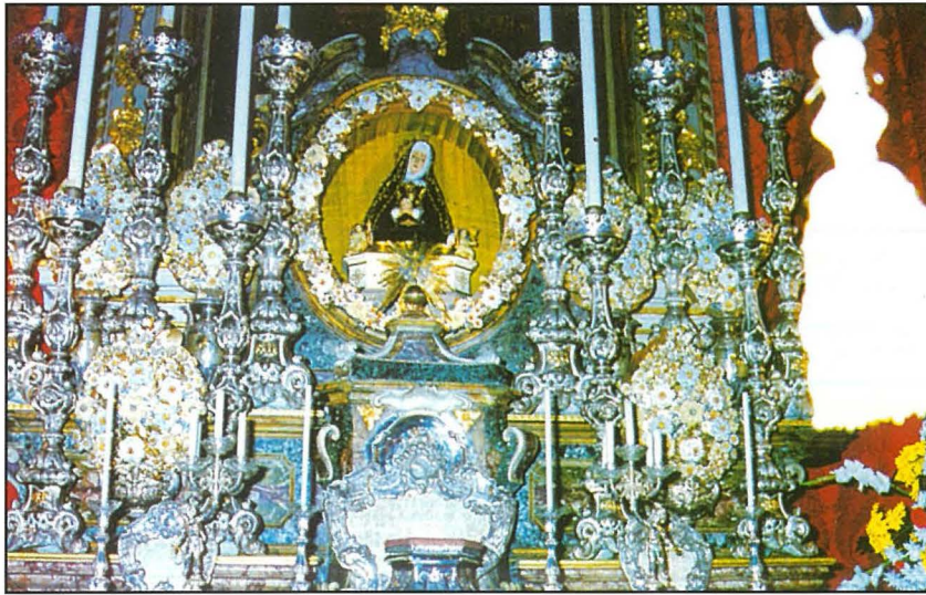
Marija Addolorata meqjuma fuq l-artal tal- Kurċifiss

ta' Malta, sakemm is-Superjuri ma jordnawx xort'ohra. Id-Dumnikani ddiskutew din id-deċiżjoni u qablu li billi diġà kellhom Kurċifiss devot hafna, sabih u mahdum fl-injam fl-1615 fil-knisja taghhom ta' Porto Salvu, il-Kurċifiss ta' Kandja jaghtuh lil Bormla. (Mhux il-każ li nkomplu nitkellmu aktar fit-tul dwar dan f'din il-kitba.)