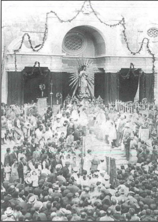
Il-kxif ta' l-istatwa fit-18 ta' Ġunju 1905.