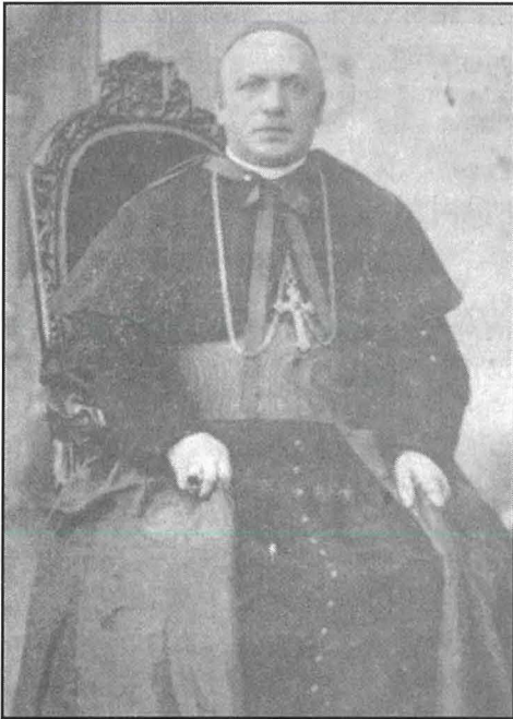
Kard. D. Ferrata

hareg ċirkolari fejn ta tifsira ta' l-inkoronazzjoni – incoronare Maria, significa adorare, onorare, lodare Dio Padre... – u heġġeġ sabiex nhar l-20 ta' Ġunju ghal xi l-5.00pm jindaqqu l-qniepen tal-Kon-Katidral ta' San Ġwann, tal-knejjes tal-Belt Valletta, tat-Tlett Ibliet u tal-Kalkara bhala sinjal ta' merħba lill-Kardinal. Heġġeġ biex jittellghu l-bnadar fuq postijiet prominenti u li nhar il-21 tax-xahar il-Kurja kellha tibqa' magħluqa. Ghal nhar il-kurunazzjoni heġġeġ biex ikun hemm mixgħela tal-knejjes.