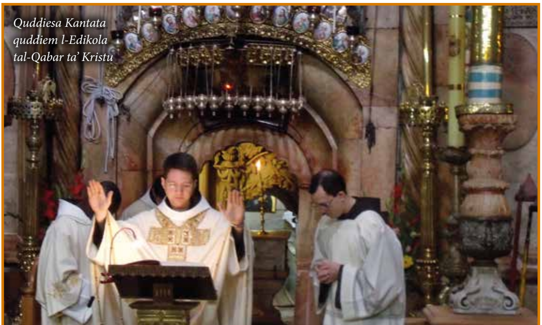
Quddiesa Kantata quddiem l-Edikola tal-Qabar ta' Kristu

Ma tkellimniex dwar il-Knejjes Protesanti fl-Art Imqaddsa, l-aktar il-Knisja Anglikana, bil-Katidral ta' Saint George (1841), u l-Knisja Luterana bir- Redeemer Church (1886) li hemm maġenb il-Bażilika tal-Qabar ta' Kristu.