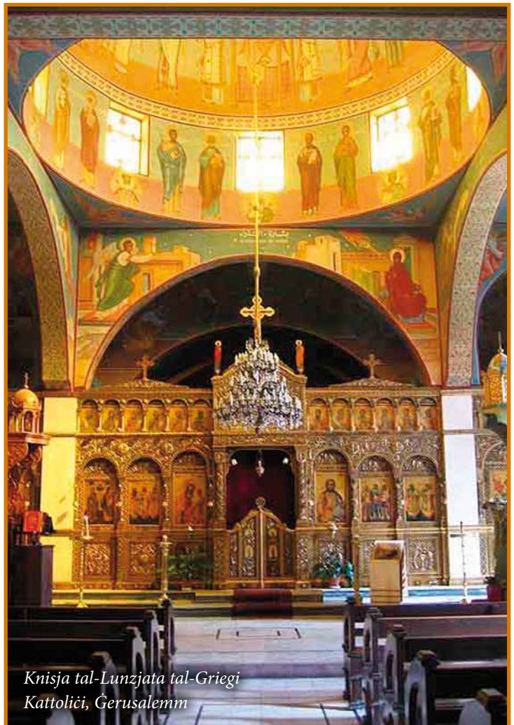
Knisja tal-Lunzjata tal-Griegi Kattoliċi, Ġerusalemm

ta' Haifa u esarkat (djoċesi) ta' Ġerusalemm. Fil-Ġordanja l-Griegi Kattoliċi huma madwar 35 elf preżenti fl-arċieparkija ta' Filadelfia (Amman) u Petra. Huma jiddependu mill-Patrijarkat Melkita Grieg Kattoliku ta' Antjokja, li għandu s-Sede tiegħu f'Damasku. Fl-Art Imqaddsa l-Knisja Griega Kattolika tmexxi 70 parroċċa, taħt il-kura ta' kleru djoċesan Għarbi. Il-kura pastorali tinkludi t-tmexxija ta' skejjel, seminarji, ċentri ta' katekezi u u oħrajn ta'