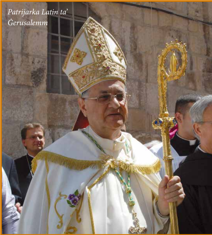
Patrijarka Latin ta' Ġerusalem

Siro-Kattolika u Kaldea) huma kostitwiti fi tliet esarkati (djoċesi tar-riti Orjentali).