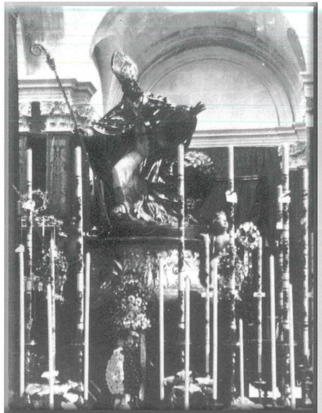
Il-vara ta' San Publiju kif kienet tkun armata bi kwantità ta' xemgħa tal-konsum mgħotija mid-devoti tal-qaddis

Billi l-ingress tal-Arcisqof Caruana fl-Imdina kellu jsir nhar id-19 ta' April 1915, jidher li minn indikazzjonijiet mogħtija mill-Arcisqof stess, il-festa ta' San Publju, li kellha tiġi ċcelebrata bħas-soltu ħmistax fuq l-Għid jiġifieri nhar il-Hadd 18 ta' April 1915, ġiet posposta għall-Hadd 25