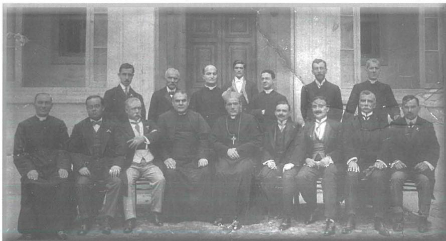
Mons. Mauro Caruana, Arċisqof ta' Malta mal- Kumitat tas-Socjetà Fil- Vilhena u dinjitarji oħra