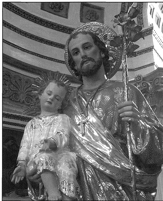
L-Istatwa artistika ta' San Ġuzepp meqjuma fir-Rotunda. Wieħed ma jistax ma jinnotax ix-xebh perfett ma' dik li tinsab f'Hal Kirkop, li iżda saret 5 snin qabel.

Din l-istatwa ntogħbot hafna u dritt sarilha pedestall sabih li ġie tasew jixirqilha. Il-pedestall huwa mzejjen bi skultura eleganti hafna. Is-sena 1889, is-sena li fiha ngħebet l-istatwa, tidher żgħra fuq l-iskudett tal-faċċata tan-naħa ta' wara tal-pedestall. Jispikkaw f'dan il-pedestall l-erba' mensoli maestużi li għandu, u li fuqhom jistrieħu erba' anġli mill-aktar helwin. Dawn saru madwar sena wara u ngħiebu mill-istess fabbrica Galard et Fils , minn fejn