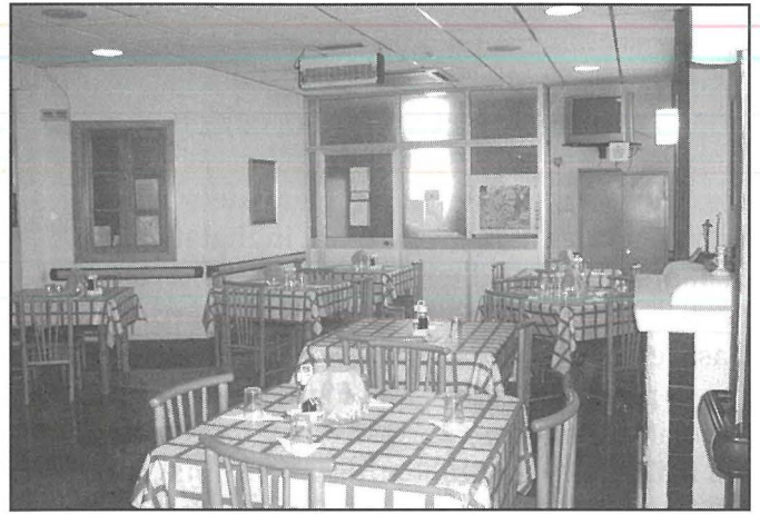
IS-SALA TA' L-IKEL FID-DAR TA' L-ANZJANI