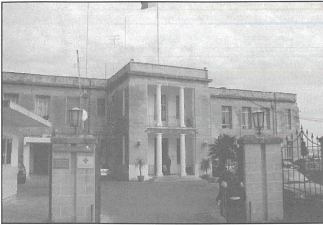
L-ISPTAR SIR PAUL BOFFA

diversi oqsma ta' kura medika inkluża Spizerija u Dental Clinic .