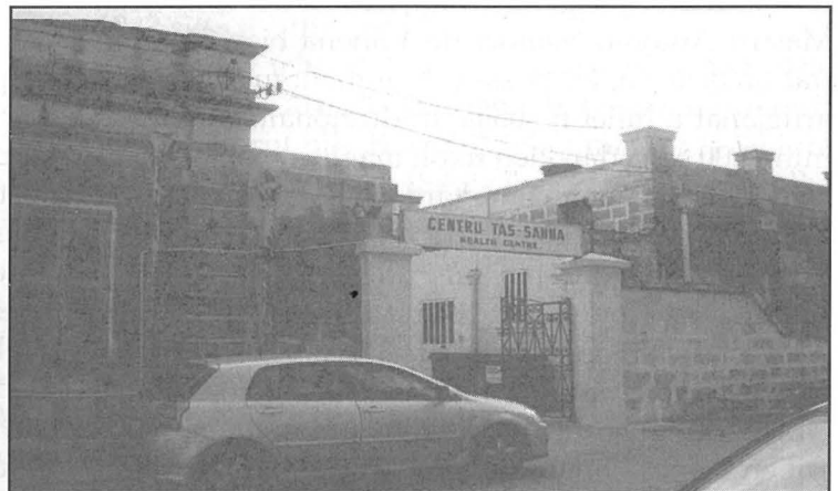
FLORIANA HEALTH CENTRE