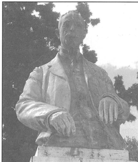
Sir Filippo Sceberras

Sir Luigi Preziosi kien tweled f'Tas-Sliema iżda